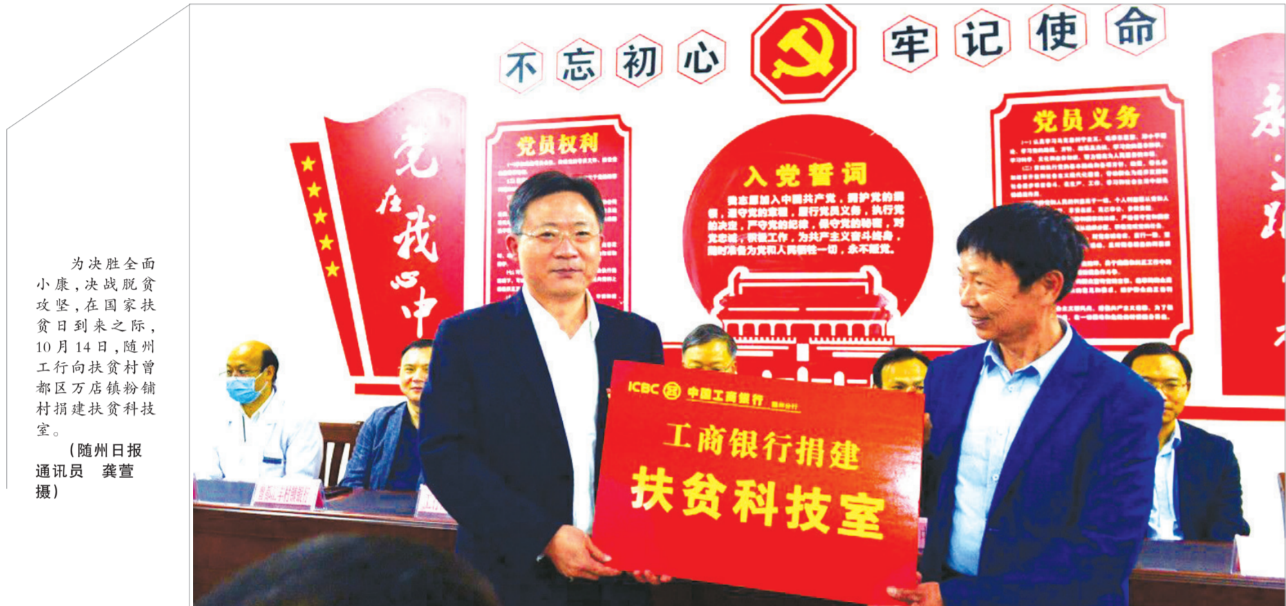
为决胜全面小康,决战脱贫攻坚,在国家扶贫日到来之际,10月14日,随州工行向扶贫村曾都区万店镇粉铺村捐建扶贫科技室。

本次宣传活动通过多途径宣传,进一步提高了居民网络安全意识,维护了正常的金融秩序,累计受益人群逾3000人。