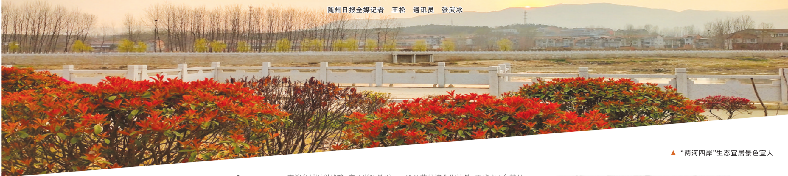
▲“两河四岸”生态宜居景色宜人