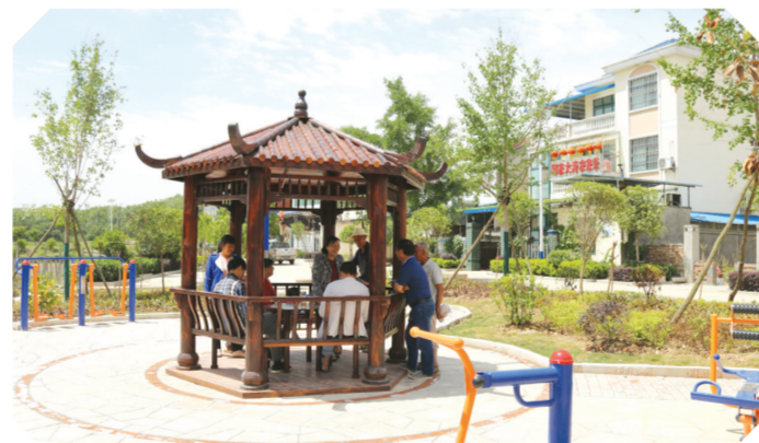
▲ 邱家大湾美丽乡村

万和镇将打造宜居环境为目标,基础设施建设和城镇功能日趋完善,人居环境和经济发展水平不断提高,群众生产、生活和居住条件得到很大改善。