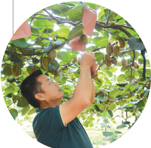
▲ 猕猴桃特色产业种植

该镇坚持强基固本,狠抓党风廉政建设,不断净化干部队伍风气。切实贯彻落实中央八项规定精神及省市县各项规定,对积极推进党员干部作风建设进行安排部署,做到了有案必查,违纪必究。坚持问题导向,结合各职能部门岗位职责,督查领导班子及其成员是否履职尽责到位。今年上半年,对森林防火履职尽责不力的3个问题线索进行调查处理,诫勉谈话处理2人,工作约谈2人。给予2名村干部党纪处分。对疫情防控工作履职尽责不力的3个问题线索进行调查处理,党内警告处分1人,诫勉谈话处理2人,工作约谈1人。对省委巡视组发现的问题线索进行调查核实,对相关的8名责任人工作约谈。