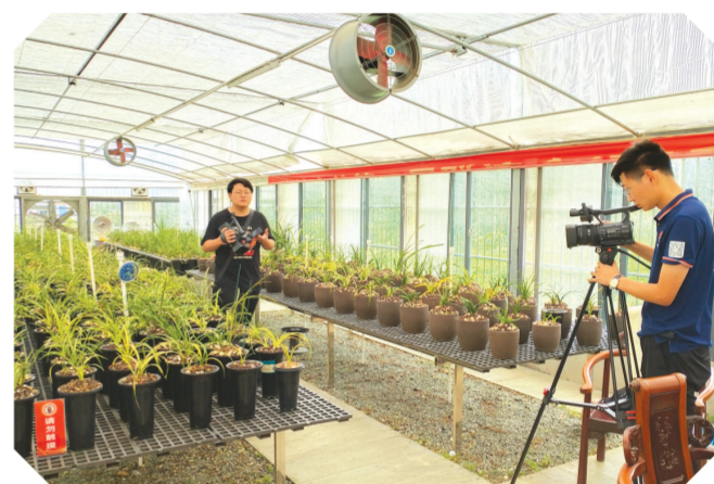
▲ 随县融媒体中心到该镇兰花培植园拍摄宣传片

响应市委品牌战略,复兴万和优势稻米。随着随州市打造“两香一油”品牌战略的提出,复兴万和佛山贡米的计划提上万和镇党委政府的日程。选育适合本土种植香稻品种。万和镇同随州一心农业有限公司合作,在试种基地种植“奥香1号、晶香丝苗、赣香占1号、科香1号、兆丰香丝”等5个品种,通过农业公司的技术观察、实验,选育最适合万和种植的香稻品种。经过仔细分析万和各村水质、土壤、气候等地理要素,万和镇确定在镇东线佛山寨村、石狮子等8个村推广香稻种植,计划种植面积10000亩,并确定了订单农业、公司管理等发展模式。除此之外,万和镇还设计了佛山香米的品牌标志,正在进行品牌注册。