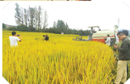
▲ 万和香稻喜获丰收