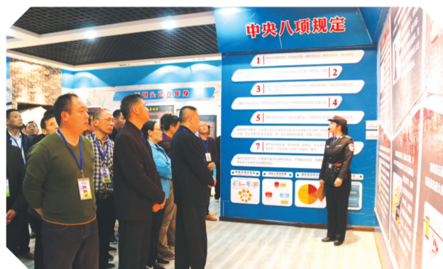
▲ 全体党员干部接受警示教育

这里如画亦如歌,孕育着勤劳、善良、朴实和执着,收获着成功、希望和辉煌。近年来,万和镇党委政府从实际出发,依托得天独厚的资源,巧借猕猴桃、兰草、香稻等优势产业,软硬环境齐抓,精神文明和物质文明同步发展,以一个又一个辉煌的业绩,谱写了该镇经济社会发展,服务民生的篇章。