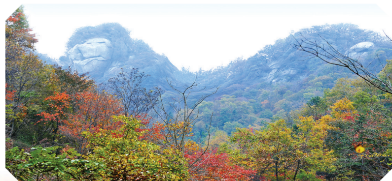
▲ 七尖峰风光——醒狮峰