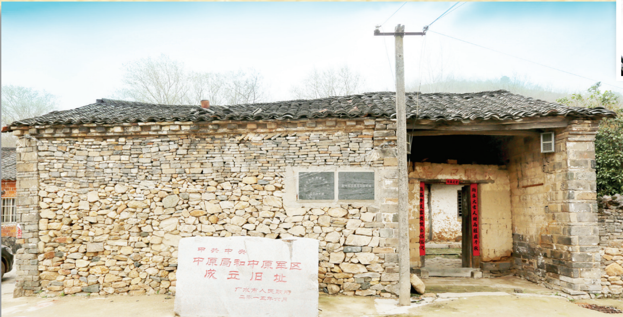
中原局和中原军区成立旧址