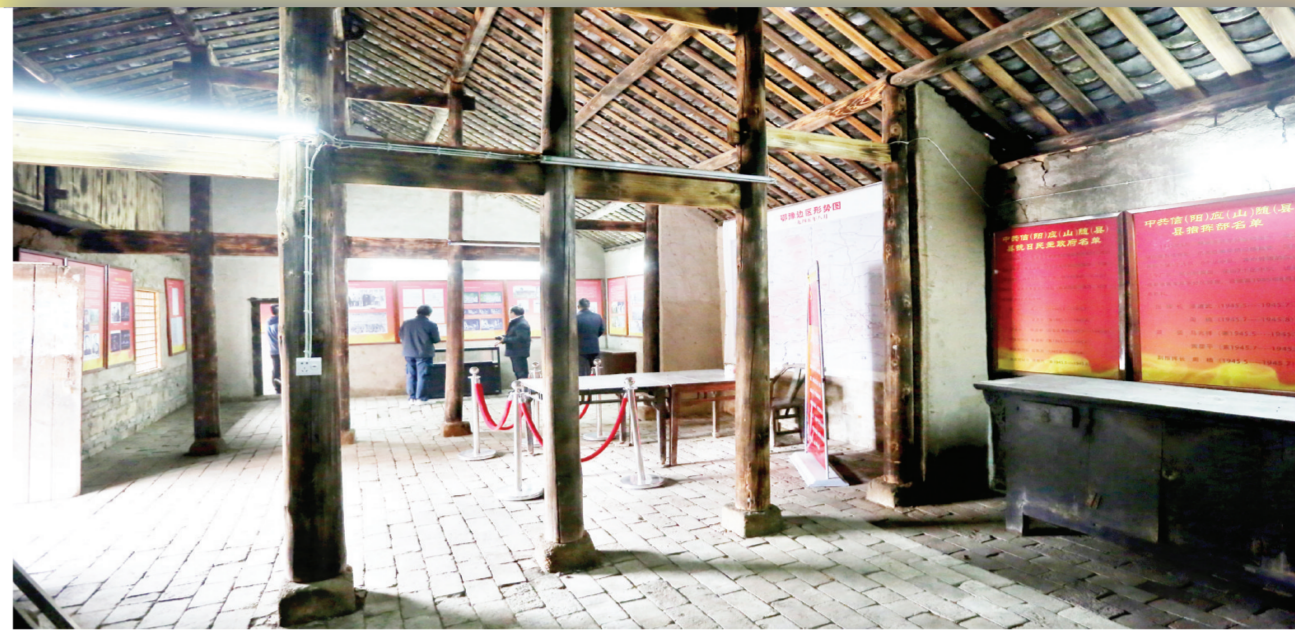
新四军五师司令部旧址