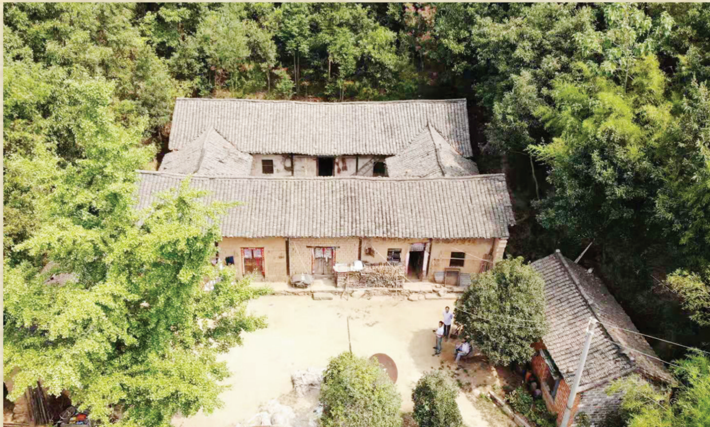
▲浆溪店三土门杨家湾——桐柏党政军成立旧址

广水市吴店镇境内的新四军第五师尹家湾革命旧址群,现有47处革命旧址,“程道荣起义会场遗址”是其中一处。就是在这里,新四军五师为程道荣起义部门召开了庆祝及欢迎大会。 程道荣(1902—1983),字耀德,河南平舆县人。1924年程道荣拉起队伍,在豫南发展到1000余人,后参加过日伪战。经过多次战役,多年发展,程道荣部在1944年有4000人,被蒋介石收编为国民党河南挺进军第十三纵队,程道荣被委任为少将司令。他趁机率部队发展到7000人,成为挺进兵团中实力最强的一个纵队。在此前后,程道荣指挥新部与日军战斗数十次。1944年7 月,新四军五师开辟抗日战场时,路经十三纵队驻地,程道荣下令“让路,谁要放一枪,提脑袋来见我!”可见,程道荣爱国情怀,怀民族大义。正因如此,新四军五师开赴湖北后,中共鄂豫边区党委和新四军五师先后派河南工委统战部部长齐光、豫鄂边区民运部部长姜光涛、五师骑兵连连长李刚(程道荣的表兄弟)、河南军区秘书李华轩(程道荣的同事)、豫南军政干校教育长徐达三等三人,数次到十三纵队司令部做程道荣的说服教育工作,以争取驻扎在汝(南)正阳(山)一带的国民党顽固势力第十三纵队。 经过中共多方努力,程道荣下定决心