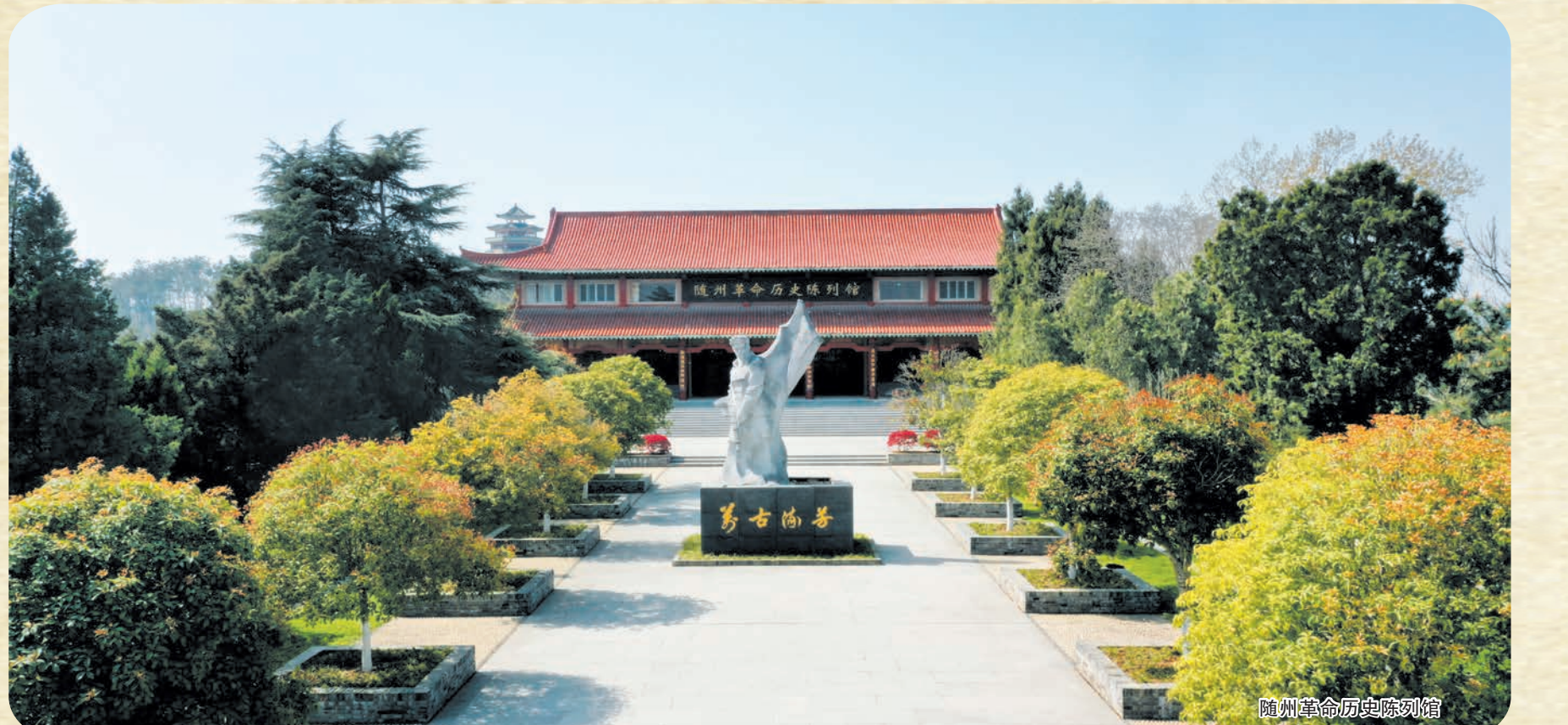
随州革命历史陈列馆