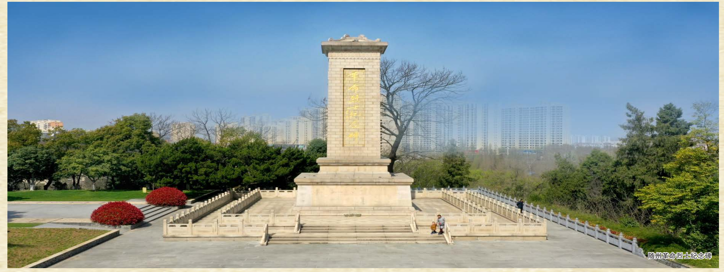
随州革命烈士陵园纪念碑