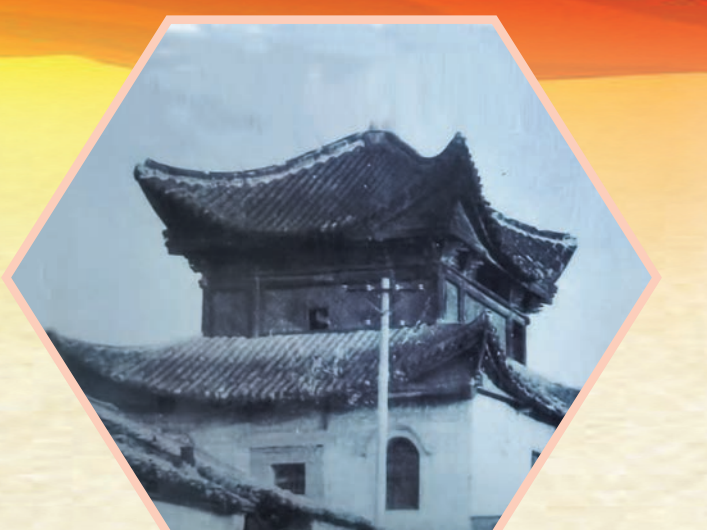
应山县农民运动讲习所旧址——魁星楼原貌

随州是一片红色的土地。百年来,随州儿女始终紧贴祖国的脉搏,紧紧跟随中国共产党,在战争年代、和平建设、改革开放各个时期,英雄辈出——