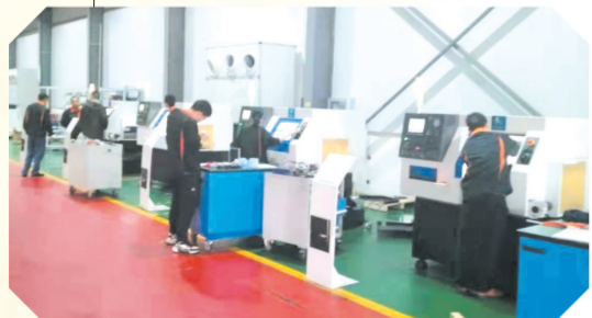
▲ 华利源科技有限公司生产车间

配套周边环境整治,让企业生产“舒心”。2020年,对工业基地辖区内主干线、十长线、应山大道、企业周边辅道进行集中整治。动用铲车、推土20台套,清除建筑垃圾、生活垃圾、杂物1.2万方;拆除临时建筑30处;沿户外广告、“牛皮癣”一律清除;清除绿化带内菜园35处;清除绿化带内枯草、杂草、垃圾;添置垃圾桶300个;更换破损下水井盖6处;新建垃圾分类亭6处;对极少数无法整治的路段,实行围挡挂绿8千米;补植景观绿化树10万株;植绿1万平方米;沿主干道、辅道补装路灯千余盏,全力为企业打造舒心亮丽的工作生活环境。