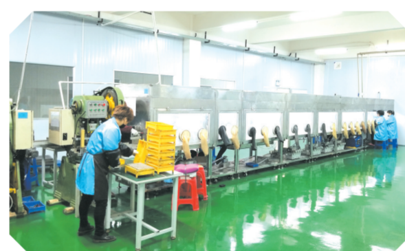
▲ 嘉旭能源科技有限公司生产车间

创新驱动,是园区升级的“亮剑”行动。广水市工业基地不断强化项目建设,优化发展环境,实施创新驱动,园区经济得到迅速发展。