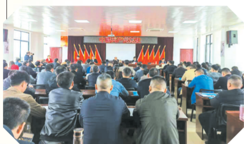
▲ 党史教育宣讲大会

注重党员队伍和阵地建设。做好村(社区)“两委”干部、后备干部、入党积极分子的培训工作。2020年共发展预备党员5名,培养入党积极分子12名,5名党员转正。招录党建助理员2名,社区工作者4名。加强基层组织阵地建设。2020年,新建双岗、灵山2个村的党员群众服务中心。