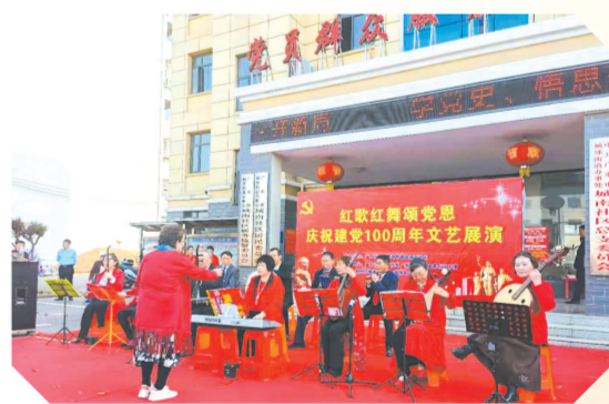
▲ 城南社区老年歌舞团庆祝建党一百周年文艺汇演

认真落实“十四五”乡村公路发展规划。工业基地超前谋划,积极对接上级乡村振兴、精准扶贫等惠民政策,按照打造致富路、脱贫路、产业路、生态路、旅游路的目标,高起点、高标准、高要求规划建设乡村振兴循环路。计划新建乡村循环路21.5公里,打通346国道、210省道新入口,贯穿4个村(社区)的43个自然湾,总投资1200万元。