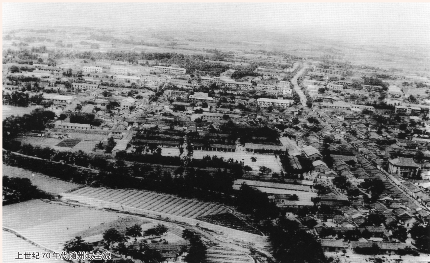
上世纪70年代随州城全貌

百年征程,启航新征程,全面建设社会主义现代化国家的新征程已经开启,新的长征需要凝聚每一个人的力量,让我们不忘初心、牢记使命,“永远跟党走”,传承革命精神,从党史中汲取奋进力量,锻造“铁肩膀、神随州”建设,不断满足“人们对美好生活的向往”,书写新时代更加光辉灿烂的篇章!