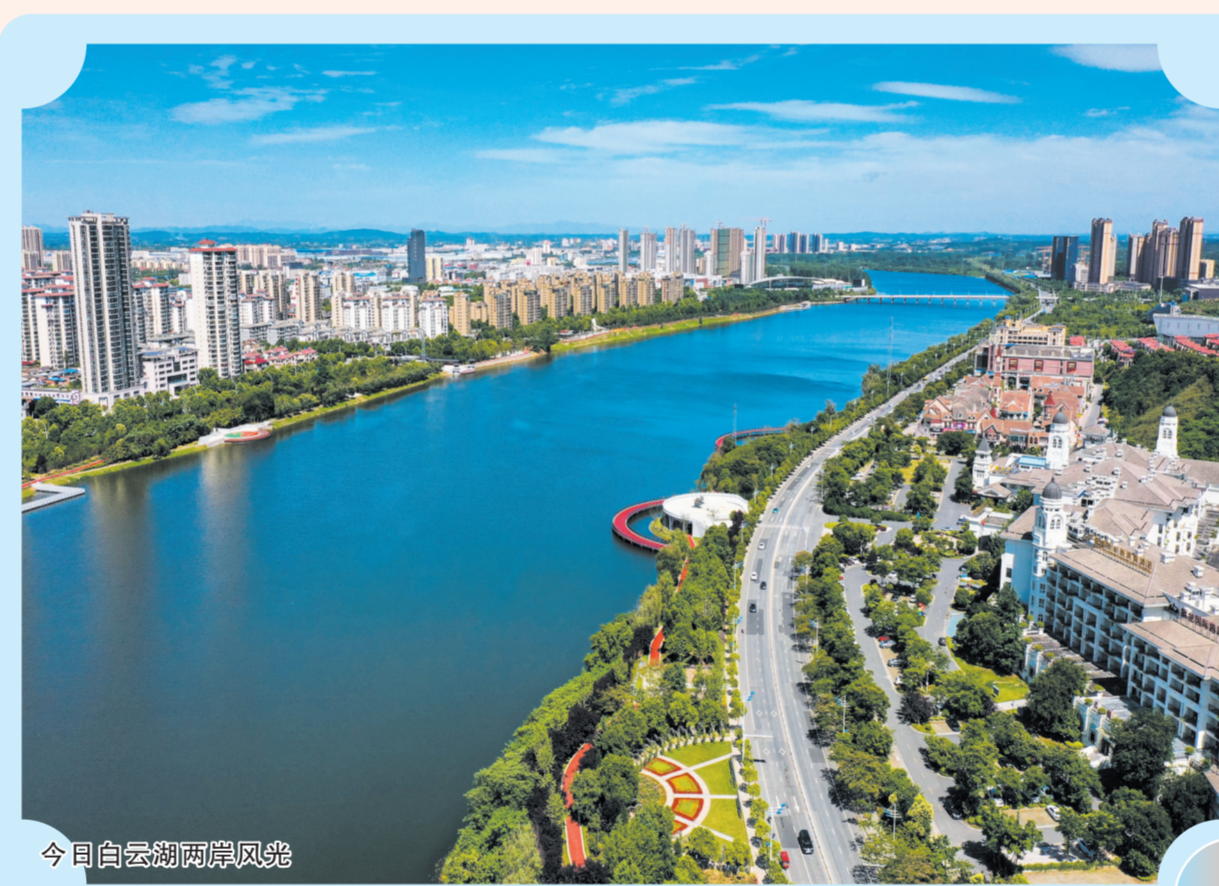
今日白云湖两岸风光