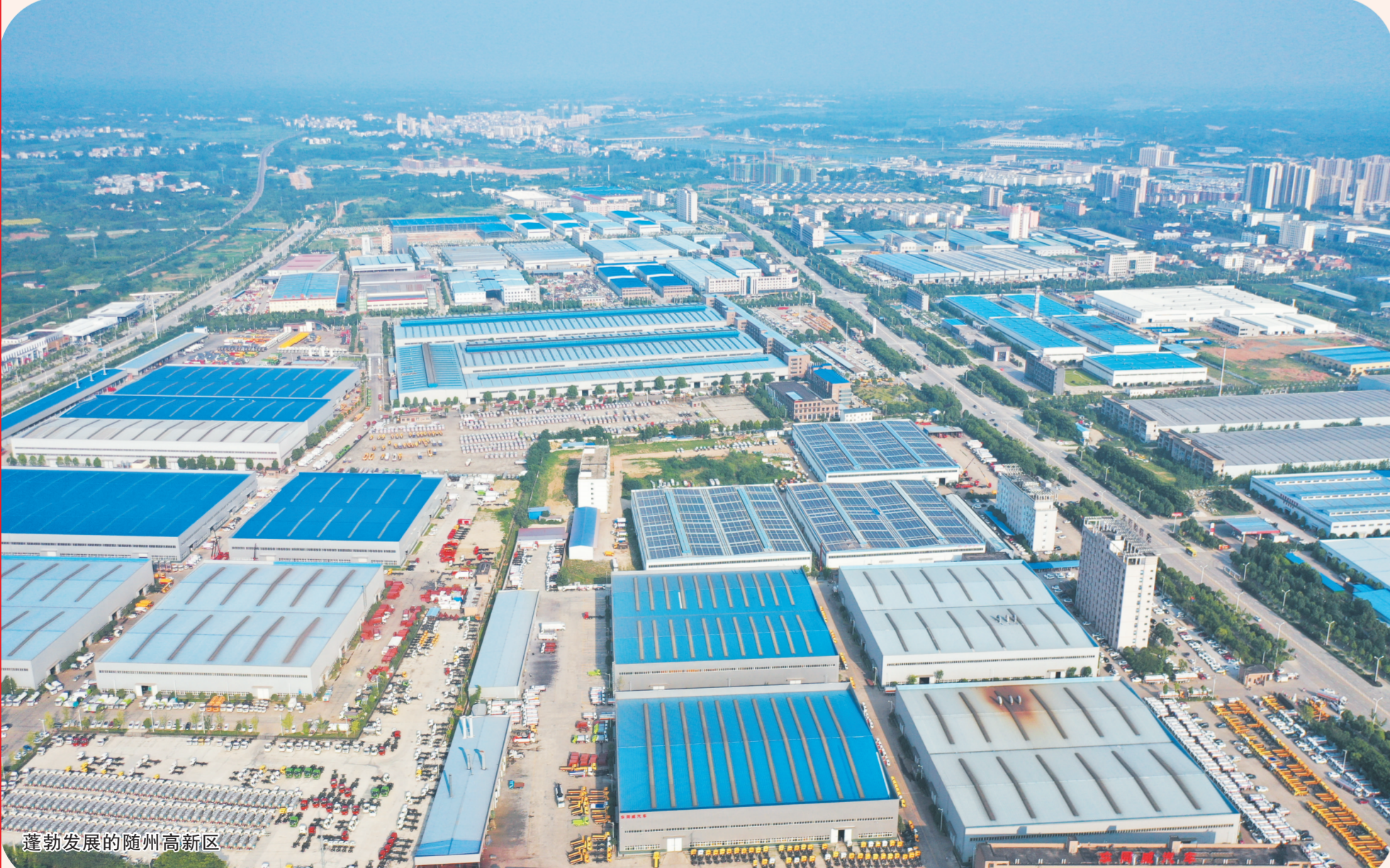
蓬勃发展的随州高新区

本版文字 王董斌 包东流