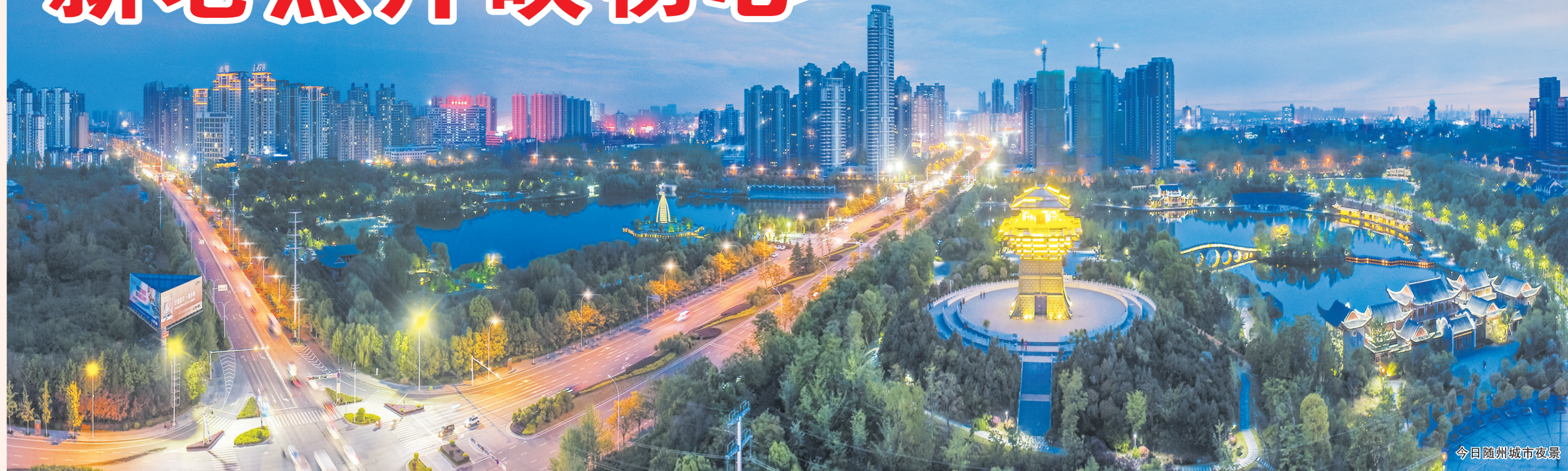
今日随州城市夜景