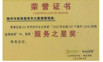
▲ 2020年7月,市政务服务和大数据管理局政务服务热线荣获全国“服务之星”

征途漫漫,惟有奋斗。面向“第二个百年”的奋斗目标,市政务服务和大数据管理局党组正团结带领政务大厅所有人员,不忘初心、不辱使命,当好推动改革的“排头兵”,打造政务环境的“新高地”,成为一心为民的“总客服”。