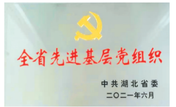
▲ 2021年6月,市政务服务和大数据管理局机关党支部荣获“全省先进基层党组织”