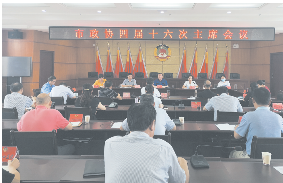
市政协召开四届十六次主席会议专题协商公共卫生服务体系建设调研情况。

五年来,市政协召开全体会议5次,征集大会发言236篇,召开专题议政性常委会议10次,主席会议专题协商3次,双月协商座谈会21次,专题协商会25次。共形成《建议案》13件、《建言资政》39期,委员提案811件,市委市政府领导批示30件(期),提案立案760件,许多意见和建议已被市委、市政府以及相关部门采纳,为政府部门改进工作、创新举措、补齐短板、解决问题提供了“政协方案”。