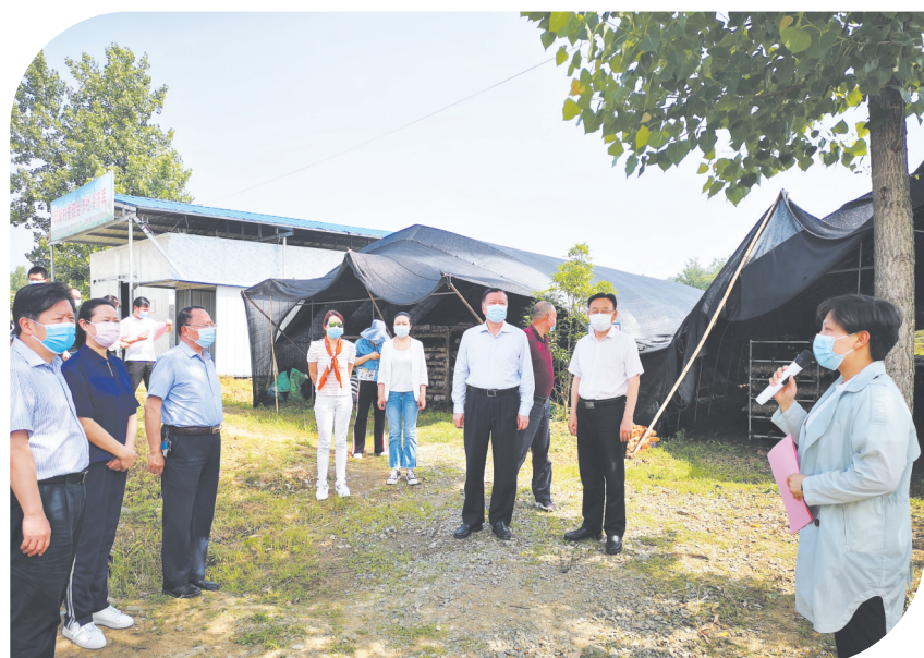
市政协视察组在曾都区洛阳镇邱碾村察看香菇扶贫共创基地。

科学确定协商议题,有效规范协商程序、改进调研视察工作,提升协商议政质效,推进成果转化运用……一系列创新之举,如“万树江边杏,新开一夜风”,为人民政协协商民主建设注入了蓬勃生机,展现了商以求同、协以成事的独特优势。