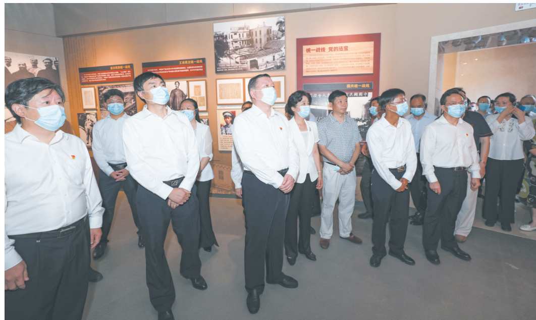
市政协四届二十五次常委会议全体与会人员参观文史馆。

五年来,市政协在思想引领、联系合作、加强宣传中凝聚共识、汇聚力量。积极为民主党派、工商联和无党派人士在政协履职创造条件,共收到民主党派集体提案55件、社情民意信息63篇;配合省政协在随就名优特农产品“走出去”等课题开展调研视察38次,大力宣传推介随州;主动服务住随省政协委员履职,向省政协大会提交《关于尽快打通汉十高速至天河机场快速通道的建议》等联名提案16件;向省政协报送《关于加强汉江中下游生态保护和补偿的建议》,10位住鄂全国政协委员就此联名向全国政协十三届一次会议提交提案,在国家层面发出随州声音!