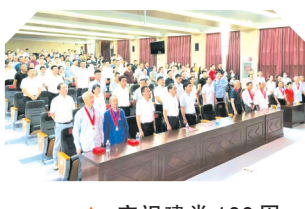
▲ 庆祝建党100周年暨重大项目签约仪式