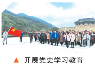
▲ 开展党史学习教育