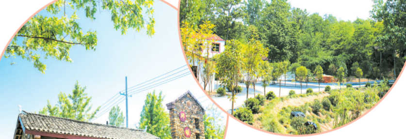
▲ 黄金堂村郭家大湾