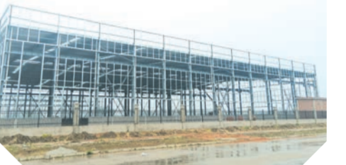
▲ 长津专用汽车生产项目正在进行厂房主体建设

喜制造、共富食品、长津汽车等一批在建项目投产达效，支持现代农业谷维生素生产、允升科技软包扣式锂电池技改扩能等项目建设，确保尽快形成产出效益。实施“三年倍增计划”，重点支持现代农业、共富牧业等龙头企业做大做强，着力培养一批具有行业影响力的“专精特新”小巨人企业和全省支柱产业细分领域隐形冠军。加快推动重点企业发展层次提升，鼓励各类企业在产品多元化、精细化等领域加大投入，全力支持现代农业冲击上市，推动一批优势企业进入上市后备计划，促进形成优势产业集群。