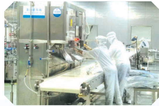
▲ 意亚食品二期(食品饮料生产线技改项目)