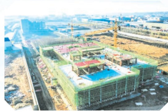
▲ 湖北共富生猪屠宰与食品加工项目