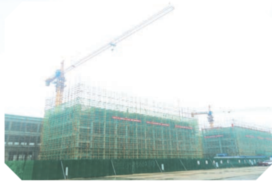
▲ 随县经济开发区科技创新产业园正在进行主体建设