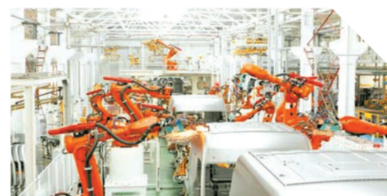
▲ 府南园区齐星公司车间

除锂电池负极材料项目外,府南产业园区先期落地的还有晶星科技、舟航装备、齐星精密、鸿星钢构四家公司。 府南产业园区位于随州高新区东南部,规划面积17.5平方公里,建设用地11.95平方公里,规划总人口5.5万人。园区内水资源丰富,拥有良好的生态环境,东北面为随州规模最大的“欢乐世界”游乐园;西部