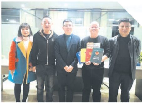
▲ 为龙牧专汽办理四证联发

铁北产业园区占地约9平方公里,范围涵盖高新区祁民社区及秦湾社区部分区域,因坐落于汉丹铁路随州火车站以北,故得名“铁北产业园区”。 铁北产业园区交通便利,汉丹铁路、新316国道贯穿其中,青年东路、解放东路连