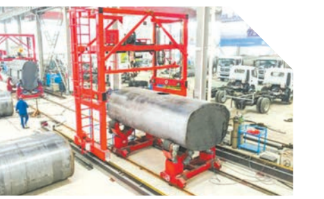
▲ 凯力专汽生产车间

雄心和决心,以全速奔跑的姿态,开启建设国内一流的电子信息产业基地、中部地区重要的应急汽车产业基地、全国特色食品加工产业基地和全市数字经济高新示范基地的新征程。 城东产业园区,一个投资的洼地、创业的福地、发展的高地,始终与您携手并肩,共赢未来!