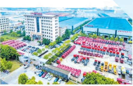
▲ 城东园区新东日产专汽厂房

走进随州高新区城东产业园区,一条笔直宽阔的园区大道四通八达,一栋栋崭新的厂房干净整洁,园区内机声隆隆,工地上车来车往,一派繁忙景象。