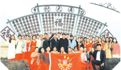
▲ 校工会、团委组织青年之家赴唐县镇华宝山开展研学活动

狠抓落实,确保党建工作改革见成效。该校落实党建工作责任制,实行“一岗双责”。做到党建工作与业务工作同部署、同落实,大力开展学习型、创新型、服务型、效能型、廉洁型、节约型学校创建活动,以创建党员先锋岗、党员示范岗为载体,引导广大党员立足本职岗位发挥先锋模范作用,为学校事业发展奠定基础。严格党员教育管理监督,加强党务干部队伍建设。注重选拔政治强、业务精、作风好的干部,认真做好入党积极分子和发展对象的教育、管理、监督,加强党务工作者培训,切实把党务干部培养成为政治上的明白人、党建工作的内行人、干部职工的贴心人。