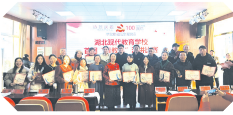
▲ 青年教师演讲比赛