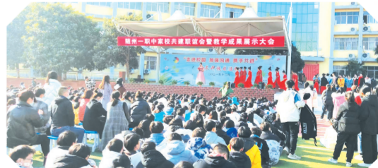
▲ 家校共建联谊会暨教学成果展示大会