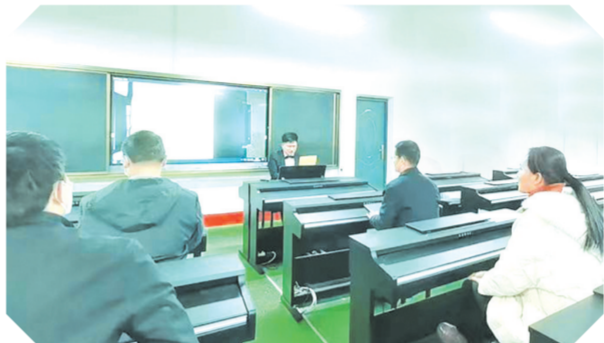
▲ 湖北现代教育学校(电大)迎接省开放大学办学水平评估