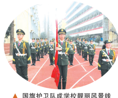
▲ 国旗护卫队成学校靓丽风景线

站在新的起点上,湖北现代教育学校将坚持以习近平新时代中国特色社会主义思想为指引,深入贯彻党的教育方针,以教育教学质量为中心,抓重点、抓亮点,求突破,努力探索教育发展的新思路、新途径、新举措,为经济社会高质量发展培育各类高层次人才和技术实用人才,以优异成绩迎接党的二十大胜利召开。