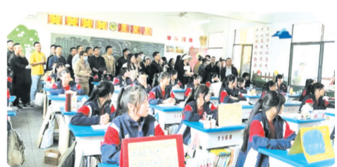
▲ 湖北现代教育学校(实验高中、随州市第一职业中学)开展班级文化建设评比活动