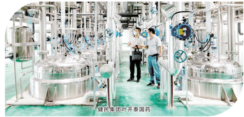
健民集团叶开泰国药