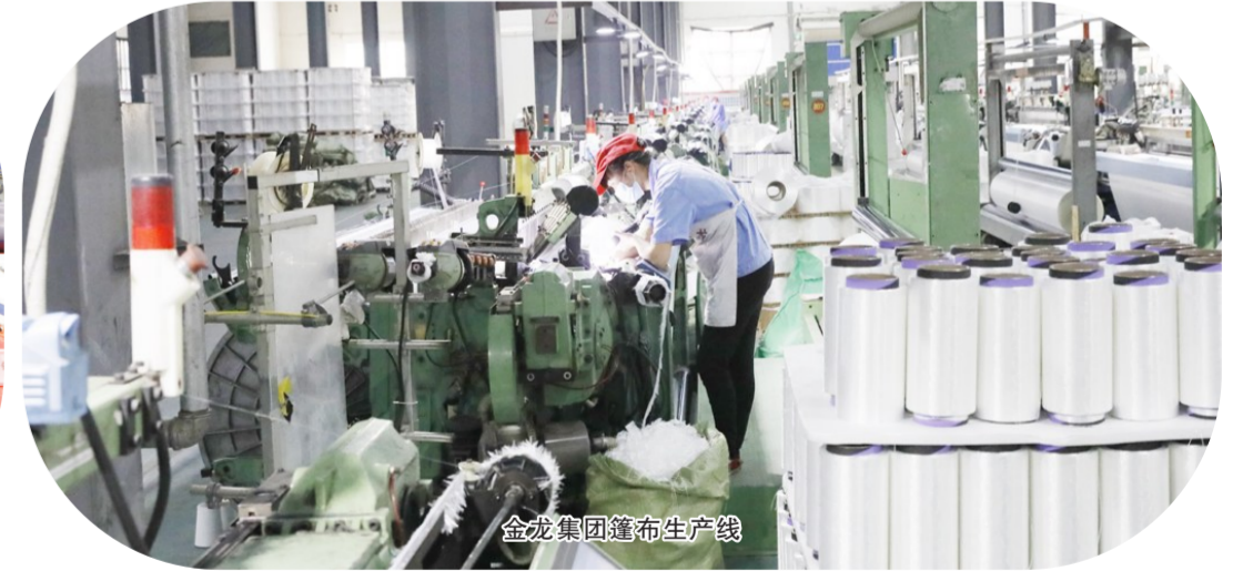
金龙集团篷布生产线