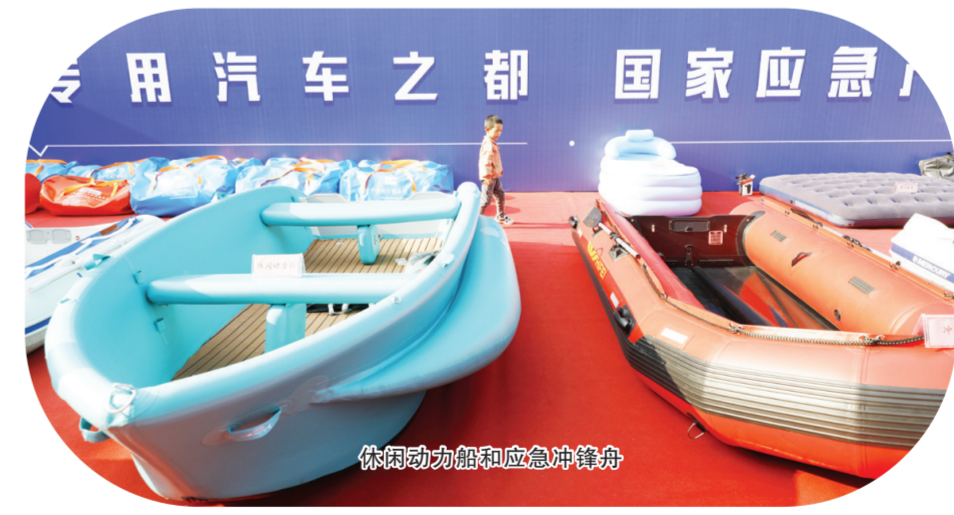
伟康动力艇和应急冲锋舟

以金龙集团等企业为代表,应急篷布年产2亿平方米,占全国市场份额30%以上,远销海外40多个国家和地区。