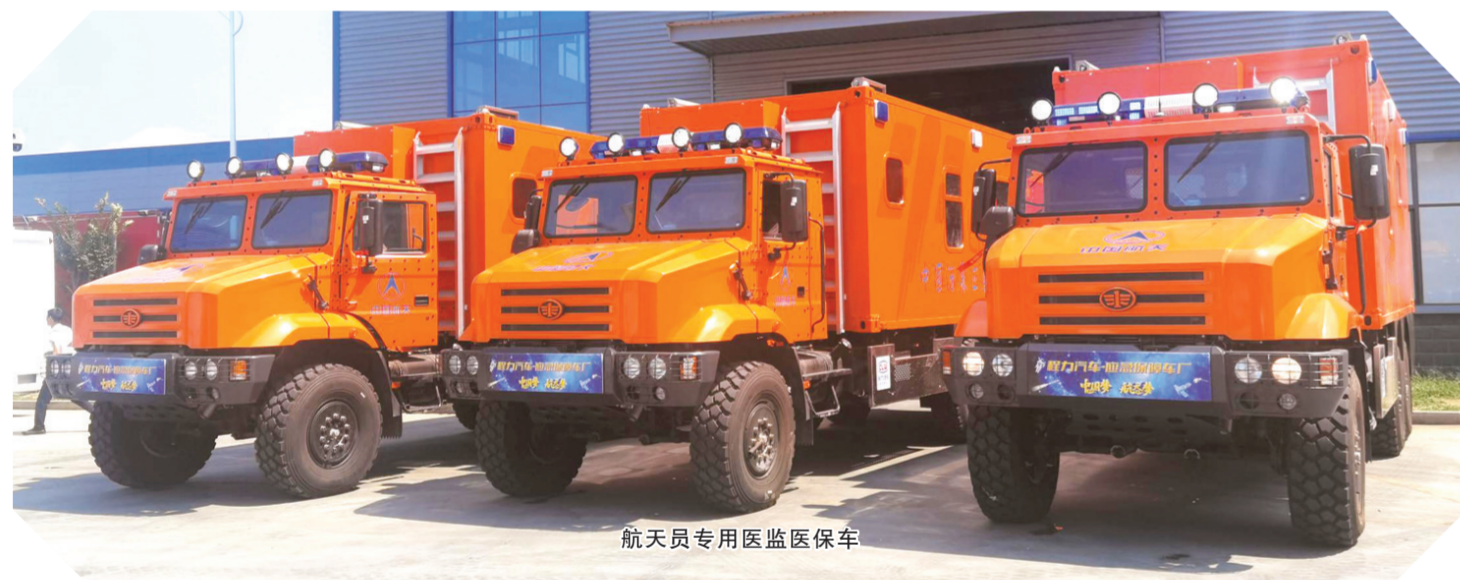
航天员专用医监保车