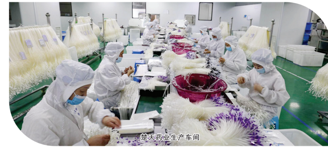
楚天药业生产车间