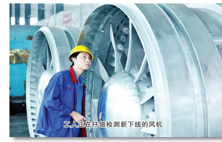
工人在仔细检测新下线的风机

以三峰透平、双剑等企业为代表,可开发生产高、中档60多个系列1000多种规格型号的产品,年产值100多亿元,其中地铁风机市场占有率达30%以上。