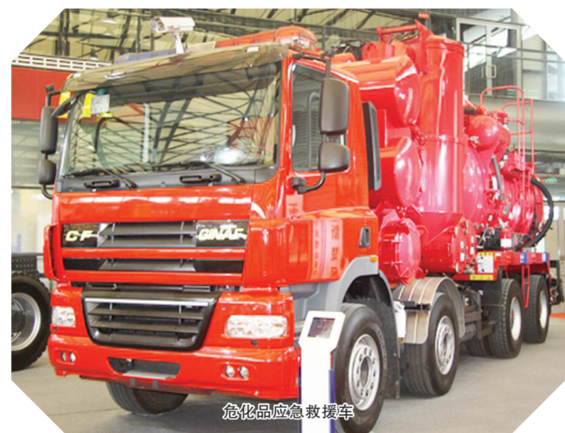
危化品应急救援车