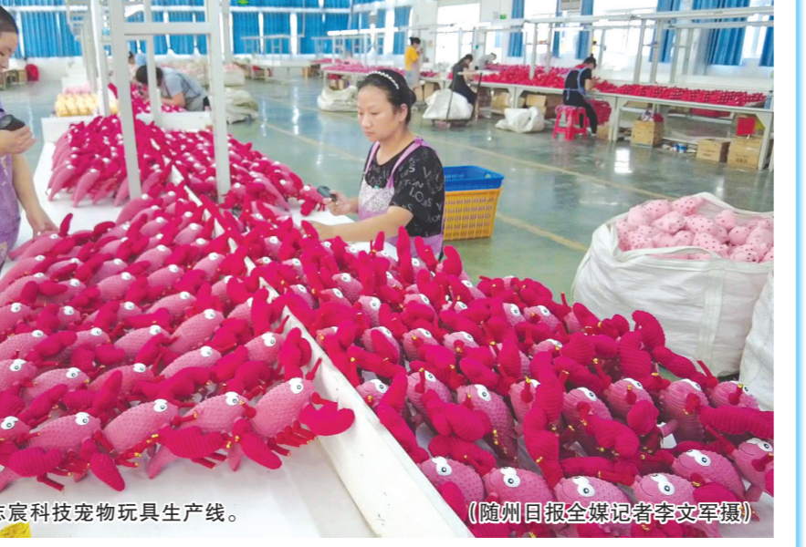
湖北志宸科技宠物玩具生产线。

唐县镇水果种植历史悠久。近几年,该镇探索在坡地上种油桃、毛桃,选育上市早、口感好的品种推广种植,并以“华宝山水果基地”为示范引领,带动农户扩大种植了桃子、李子、杏子、蓝莓、葡萄、大枣等,年产值达9亿余元。还强化特色农业产业链补链,农户卖桃赚钱,割桃胶也能赚钱。湖北省康之源农贸科技公司,主要负责收购加工桃胶,年销售额近3000万元。 蔬菜种植是唐县镇又一“特色”。唐县镇的“鲁城萝卜”远近闻名,还是“湖北省农业标准化马铃薯示范乡镇”。该镇推广