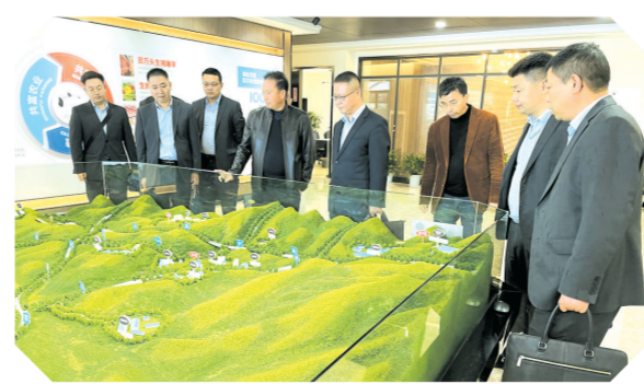
▲ 助力企业做大做强