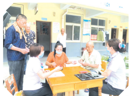
▲ 到福利院上门服务

初心如磐,笃行致远。随州农行坚守初心,坚持定位,以随州人民的信任为动力,以提供优质金融服务为方向,以高质量稳健发展为目标,紧紧围绕服务实体经济、防控金融风险、深化金融改革三项基本任务,为加快建设幸福美好随州提供更加优质、更加高效的金融支撑。