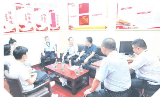
▲ 调研民生保障项目

为切实解决小微企业“融资难、融资贵”问题,该行切实简化信贷流程,主动提高服务效率。按照“能简尽简、能合尽合”的原则,推行“一次调查、一次审查、一次审批”制度,缩短业务流程链条。推广小微企业信贷业务“多事项审批”功能,评级、分类、授信、用信在系统中同步审批。推广小微企业信贷模板,提升运作效率和标准化程度,利用移动平台、人脸识别等技术手段,加强业务流程的集成优化和办理便捷度,进一步提高办贷效率。