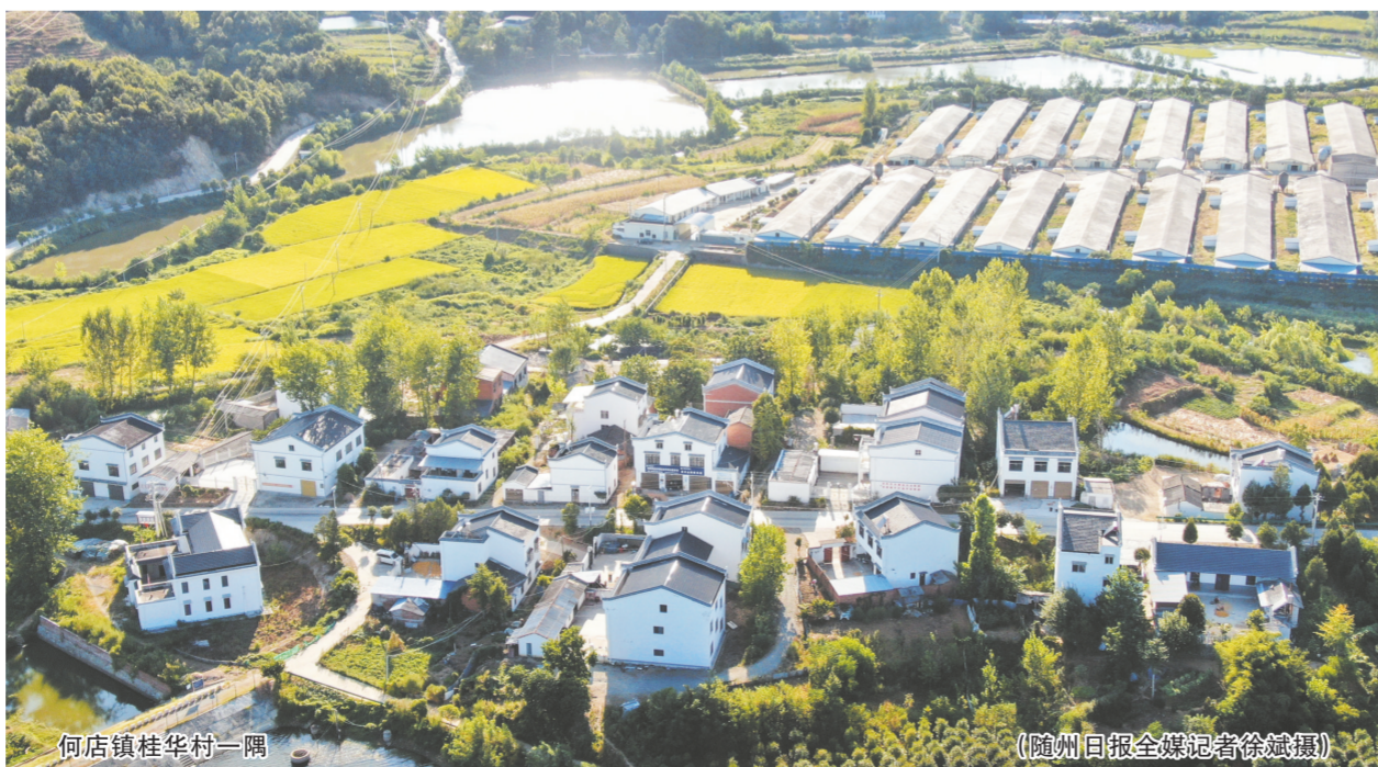
何店镇桂华村一隅

示范区依托资源优势和发展基础,重点打造软件新材料应急产业集群、出版印刷产业集群、现代商贸服务产业集群、生物医药产业集群、外向型高端农产品加工产业集群。