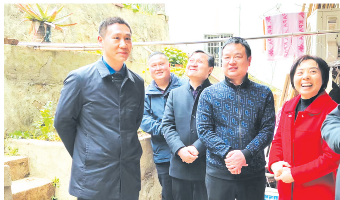
▲ 广水市委常委、副市长钟伟查看地质灾害隐患点