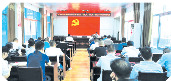
▲ 开展“下基层、察民情、解民忧、暖民心”实践活动推进会