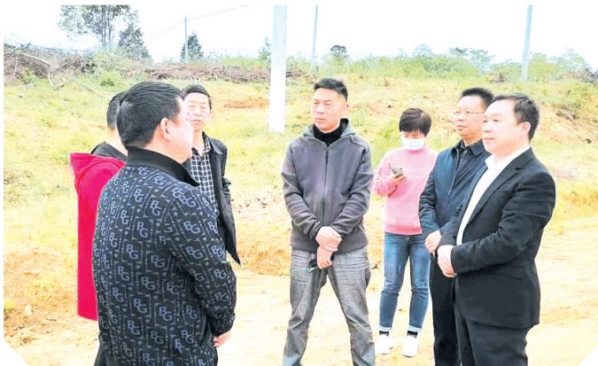
▲ 广水市委书记杨光胜调研项目用地情况