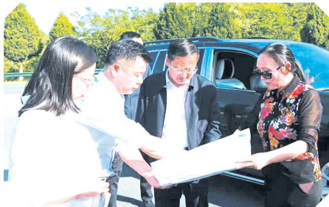
▲ 广水市长崔传金调研项目用地情况