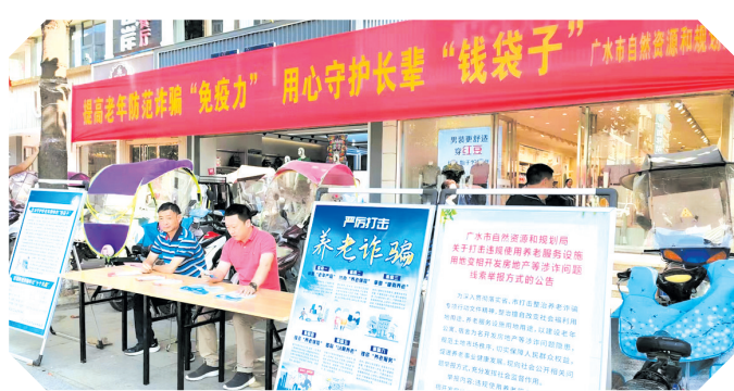
▲ 街头开展平安建设宣传活动