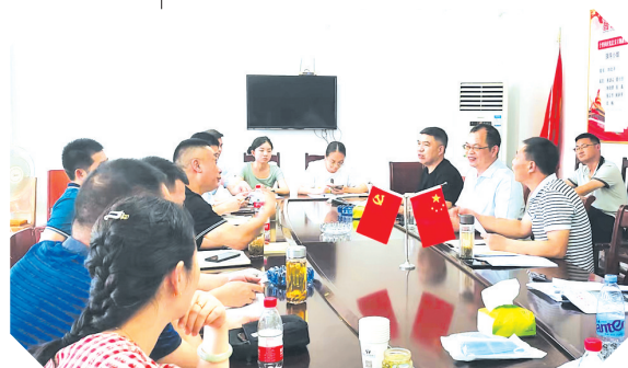
▲ 开展党员下基层实践活动