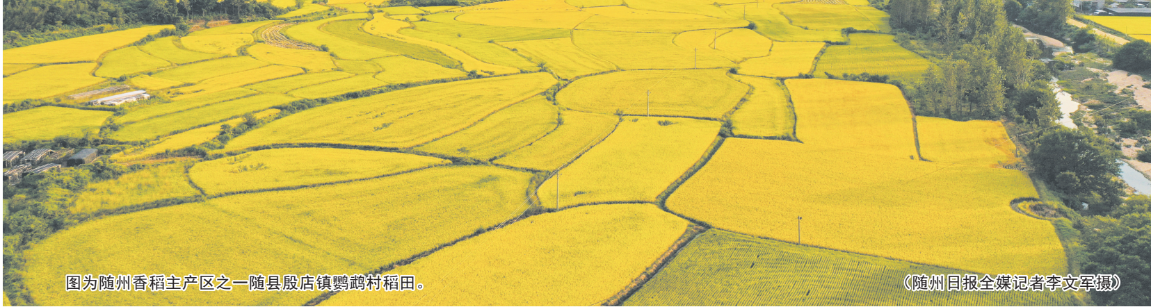
图为随州香稻主产区之一随县殷店镇鹤鸣村稻田。