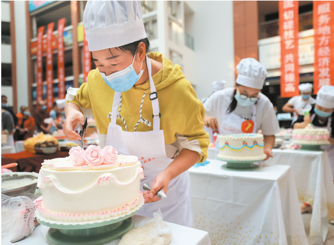
9月29日,随县举办“随县工匠杯”第三届职业技能大赛。来自全县的60名选手,参加中式面点师、西式面点师两个项目的角逐,大家同台竞技,交流展示风采。据了解,近年来,随县积极实施技能人才振兴计划,弘扬工匠精神,先后举办过4次技能大赛。