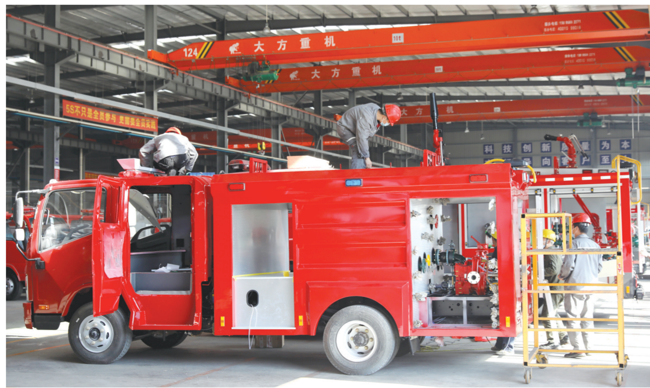
今年前三季度,中车楚胜产销两旺,产值和销售额与去年同期相比都有增长。图为10月19日,中车楚胜的工人们正在赶制消防车订单。

全市经信系统下沉企业生产一线,因企施策,精准服务,督促指导企业做好疫情防控工作的同时,帮助企业解决生产经营过程中遇到的困难和问题,确保两手抓、两不误,全力以赴奋战全年目标任务。近两天,企业服务组已帮助40余家重点企业保供生产、保物流保畅。