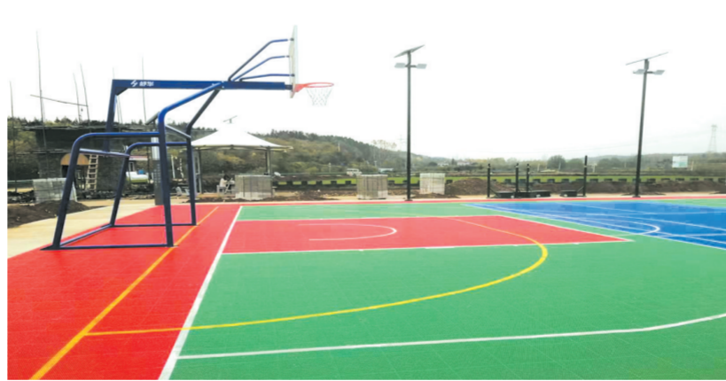
▲ 清筑城村文体广场

道:“清筑城”脏、乱、差”现象已成为过去。如今,这里像公园一样。你看看,这里的道路进行了硬化,既平整又清洁,旁边还建成了高标准停车场,住在这里真舒适啊!”