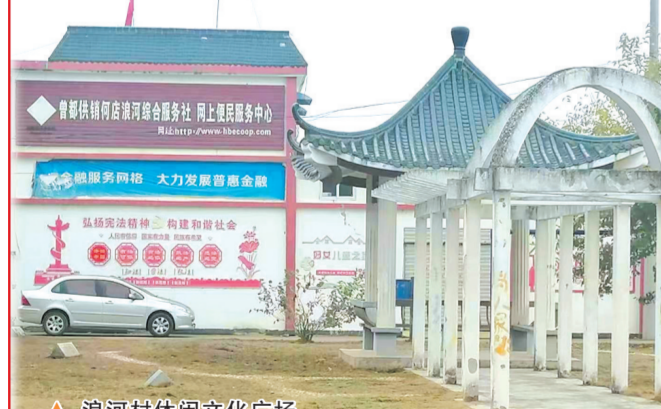
浪河村休闲文化广场