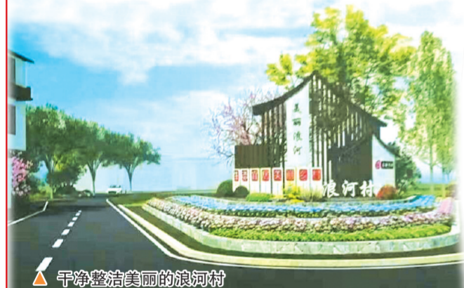
干净整洁美丽的浪河村