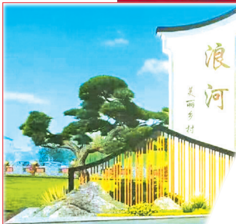
浪河村美丽乡村一隅