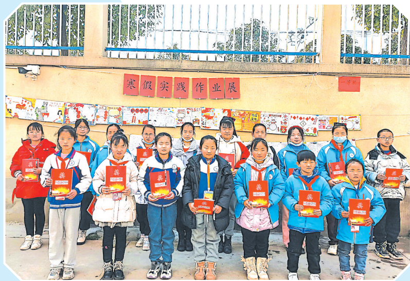
近日,随州高新区浙河镇小学开展“红领巾小书虫”主题阅读活动优秀作品展评,分享读书成果,体验读书乐趣,激发学生的读书热情,培养学生养成阅读的习惯。

在班队会上,各班主任教导学生:上下学不乘坐三无车辆,要严格遵守交通规则,做到不闯红灯、不乱穿马路,出门时自觉靠右侧人行道行走、不追逐打闹,过马路时走斑马线、做到“红灯停、绿灯行”,下车时按顺序依次下车,不推不抢,做一个安全文明出行的小公民。