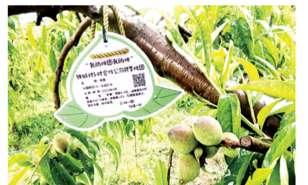
▲ 为加快融入广水市全域旅游示范带建设,推进“关庙铁城”与“郝店铁城”“两城”合作公司一、二、三产业融合发展,广水市郝店镇铁城村乡村合作公司打造联农带农共享桃园电商基地,主打“散户采摘”、“集中认购”两种运营模式,建立了“农户包种包品质,公司包销包运营”的联结机制,签订了“保底收益,增值均分”的利益共享协议,让当地“胭脂红”桃远销全国。图为郝店镇铁城村的共享桃园。