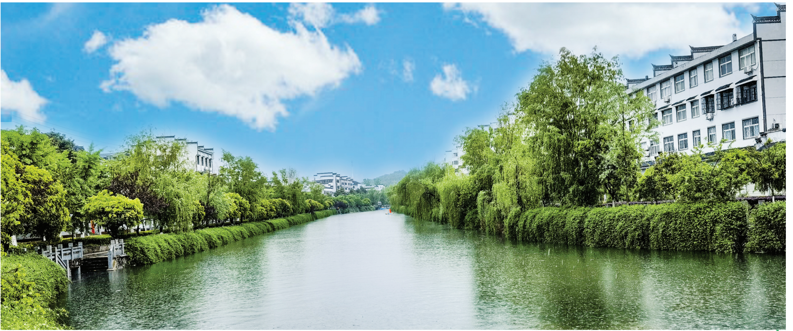
▲ 大洪山风景名胜区党工委、管委会围绕品质、洁净、美丽、井然、活力、特色、文明七大主题,以规划设计为引领,开展“三整治、三提升”行动,不断擦亮小城镇名片。图为长岗镇镇区一景。