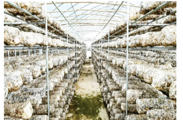
▲ 集香农业发展有限公司在随县三里岗镇吉祥寺村建成占地60亩的标准化、现代化、智能化香菇种植大棚。该公司由村股份经济合作社、村民、龙头企业、镇级合作公司共同筹资1200万元组建,2022年盈利81万元,实现了村级集体经济产业可持续发展,村民增产增收。图为三里岗镇吉祥寺村香菇种植大棚。