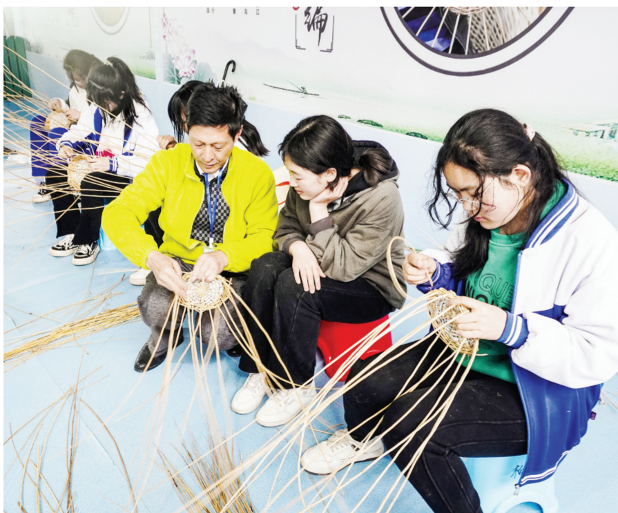
▲ 广水市郝店镇米果果小镇是省级特色小镇迷彩飞客一期项目,总投资超5000万元,建立了田野研学、科普教育、劳动教育、国防教育等多种类型的综合性社会实践活动基地,先后被评为国家4A级旅游景区、全国共享农民田间学校,年可接待学生研学及企业团建8万人次。图为郝店镇中心学校师生正在基地开展研学游活动。

▶ “国家森林乡村”、随州市“共同缔造示范村”、随县“强县工程”共同缔造试点村洪山镇温泉村扎实开展“三清两建一提升”行动,以乡村合作公司创建运营为载体,打造红色美丽村庄,发展红色经济,助推城乡融合发展,积极探索共同富裕新路径。图为温泉村电商中心正在进行直播带货。该电商中心去年营业额达到30万元,带动了当地农副产品销售,增加了农民收入。