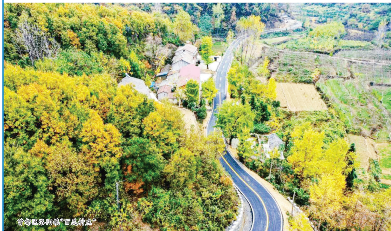
曾都区洛阳镇“百美村庄”