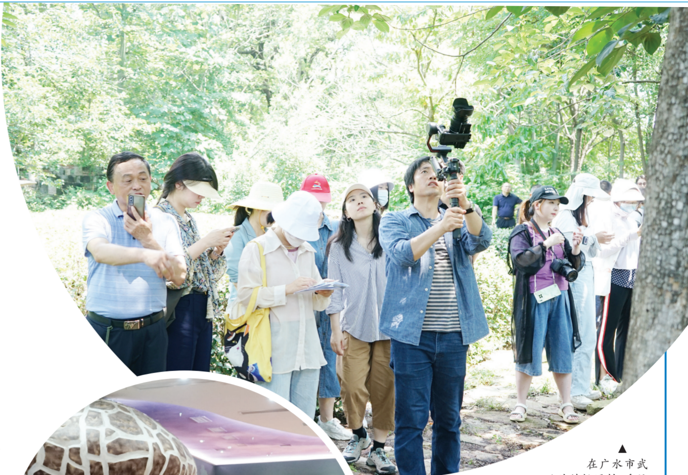
▲在广水市武胜关镇桃源村,采访团成员赏千年古柿树,感受自然之美!

近日,在省委网信办的指导下,由市委网信办、市文旅局主办的“襄十随神 随我寻根”全国媒体随州行活动启动。来自新华网、人民网、央视网、中国网、澎湃新闻、湖北日报、湖北广播电视台、荆楚网、极目新闻、一点资讯、腾讯、百度、网易、凤凰网、新浪网、抖音、小红书等全国众多主流媒体和大型商网平台记者,以及网络大V、旅游达人等100余人齐聚随州。他们深入随州各地,探访文化博览馆、文旅融合景区、乡镇特色产业种植基地等,共同见证随州发展新变化,宣传推介随州,讲好随州故事。