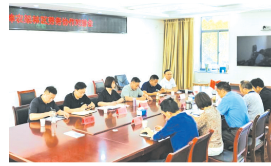
▲ 与神农架林区开展劳务协作对接