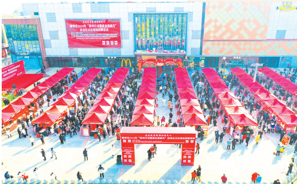
▲ 2023年“春风行动暨就业援助月”启动仪式及现场招聘活动