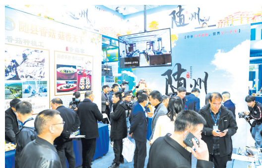
▲ 我市劳务品牌在全省首届劳务品牌展中惊艳亮相