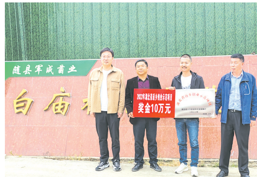
▲ 为我市返乡创业省级示范项目授牌

提升技能水平,擦亮高质量就业名片。全市人社部门把技能培训作为推动产业发展和促进就业创业的突破口,结合市场需求,有针对性地开单式、定岗式和项目制培训。2023年,全市人社部门结合市场需求和企业用工,为城乡劳动者开展免费技能培训3.8万人次。