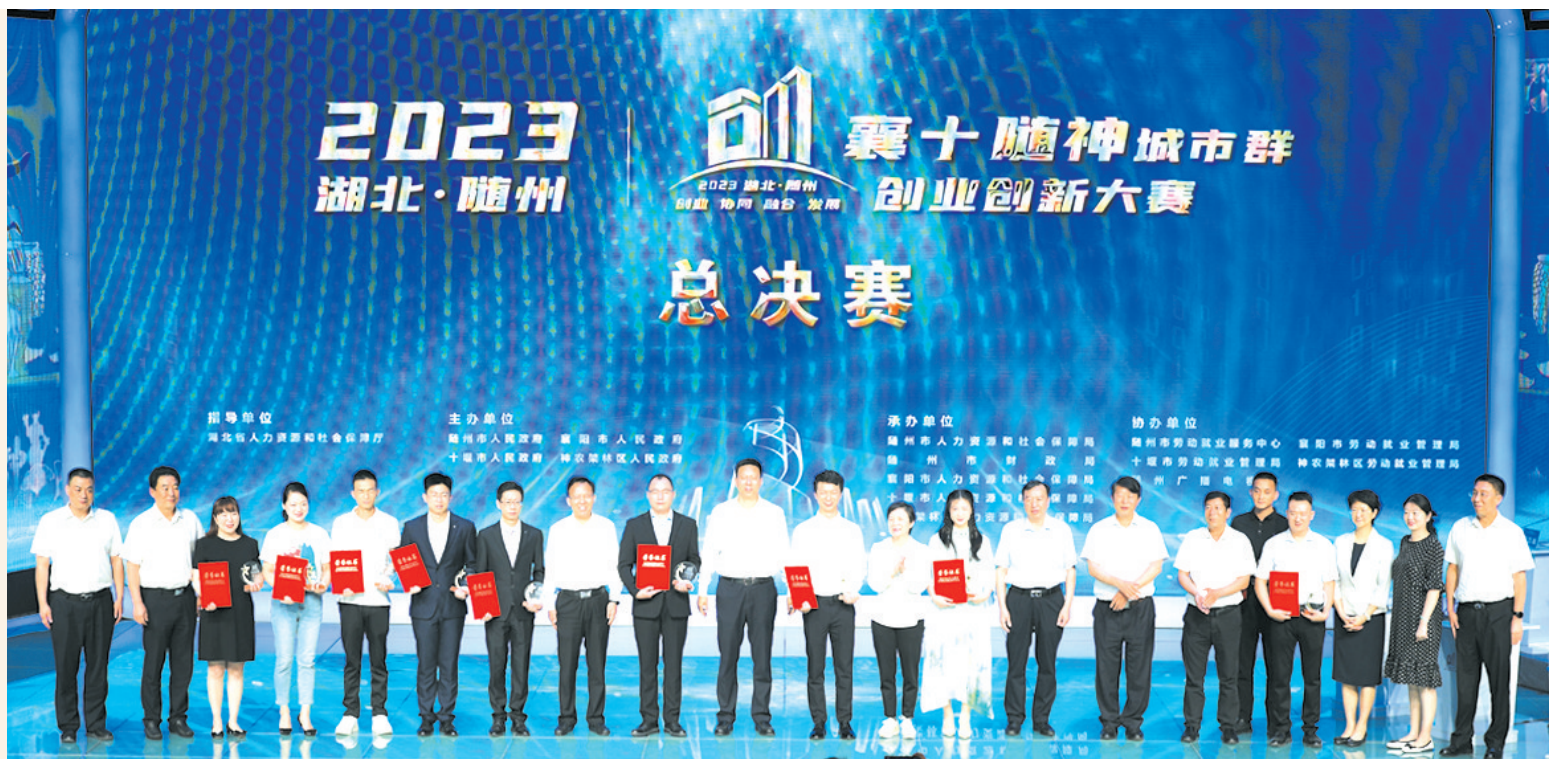
▲ 2023年“襄十随神”城市群创新创业大赛在随州成功举办

把服务送到村民“家门口”。在全省率先挂牌成立农村劳动力转移就业服务中心,把就业服务延伸到群众“家门口”,目前全市已挂牌建立县乡两级服务中心44家。通过各级服务中心(站点)开展农村劳动力信息调查工作,重点解决农村劳动力就业需求。2023年累计开展农村劳动力信息调查和录入92.83万余条,组织农村劳动力外出转移就业约38万人。