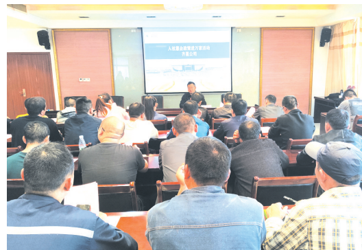
▲ 开展惠企政策宣讲送政策上门

2023年,全市大学生就业完成167%,脱贫人口就业完成104%,城镇调查失业率始终控制在5.5%以内;全市脱贫人口未发生返贫现象。