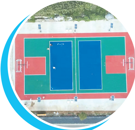
▲ 双河村文化体育广场

守望乡情，留住乡音，铭记乡愁。如今，山水清秀的双河村，正书写着万千诗意。一幅幅“传统与现代、田园与生态”的和美画卷，在绿水青山间铺展开来。