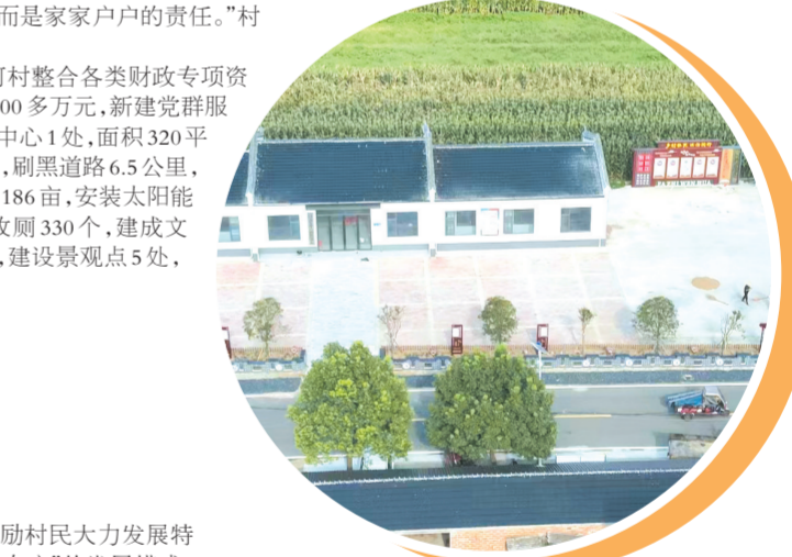
▲ 双河村李家湾和美乡村建设一隅

按照发展新蓝图，双河村力争用3年时间，聚力打造集产业、文化、旅游、观光、休闲于一体的3A级旅游景区，逐步实现资源“变”资产、资金“变”股金、农民“变”股东、农业“变”富业、农村“变”景区的美好愿景。