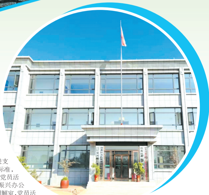
▲ 双河村党群服务中心

强组织，凝聚振兴“大合力”。实行“村党支部+网格党小组+党员联系户”组织体系，建立“群众提议、网格收集、支部牵线、党员办理”群众诉求响应机制，落实“群众点单、支部派单、党员接单”三单服务模式；完善“一门式”政务服务，群众办事扫一扫，通过“码上办”实现马上办，将“组织所做”和“群众所需”无缝对接，切实打通服务群众“最后一公里”。