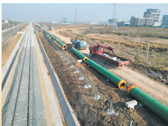
▲ 随州集中供热(暖)项目

总投资11.8亿元的湖北交投物流集团有限公司智慧供应链产业园项目,采用“基地+平台”模式,打造集铁路、高端仓储、区域分拨、城际配送、集采集销、供应链等多元业态为一体,以专汽产业为底色,以高效物流为特色的智慧供应链产业园。