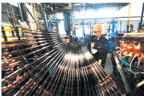
▲ 利康药业药用玻璃瓶生产线