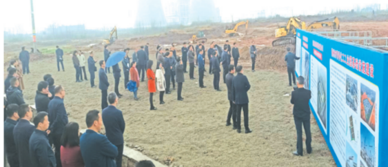
▲ 重大项目观摩拉练活动现场

今年是新中国成立75周年,也是随州高新区项目攻坚提质年、创新蝶变发展年、冲刺百强关键年。该区聚焦高质量发展主题,将聚力实施“八大工程”,牢固树立“大抓工业、抓大工业、把工业抓大”的鲜明导向,坚决扛起“产业兴市、工业强市”大旗,加快冲刺全国高新区百强。本报今日以专题形式,集中展示随州高新区一批在建重点项目。