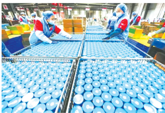
▲ 品源现代香菇酱生产线