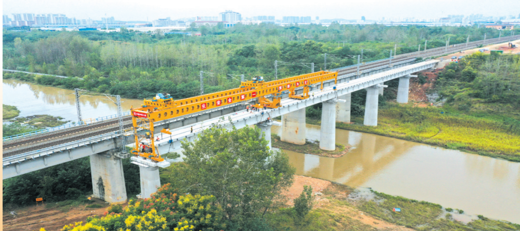
▲ 随州电厂铁路专用线