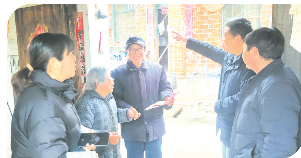
▲ 进村入户宣传医疗政策

全面提高服务质量,严格遵守医务人员行为规范和道德准则,牢固树立“以病人为中心”的服务理念,尊重关爱患者。做到“人勤、嘴勤、腿勤”,解释沟通到位,服务诊疗到位,减少患者的不理解、不信任,降低纠纷发生的概率。