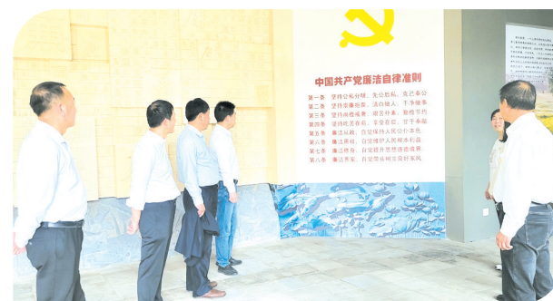
▲ 学习中国共产党廉洁自律准则

加强职工职业技术培训和学术交流,落实每月一次业务学习制度,积极参加各种培训班。请上级专家教授来院授课、手术示教等。由于在人才培养、引进、储备上投入巨大,该院在近年频繁的人员流动中,保障了各科室主要技术骨干稳定,确保了医院发展基础。