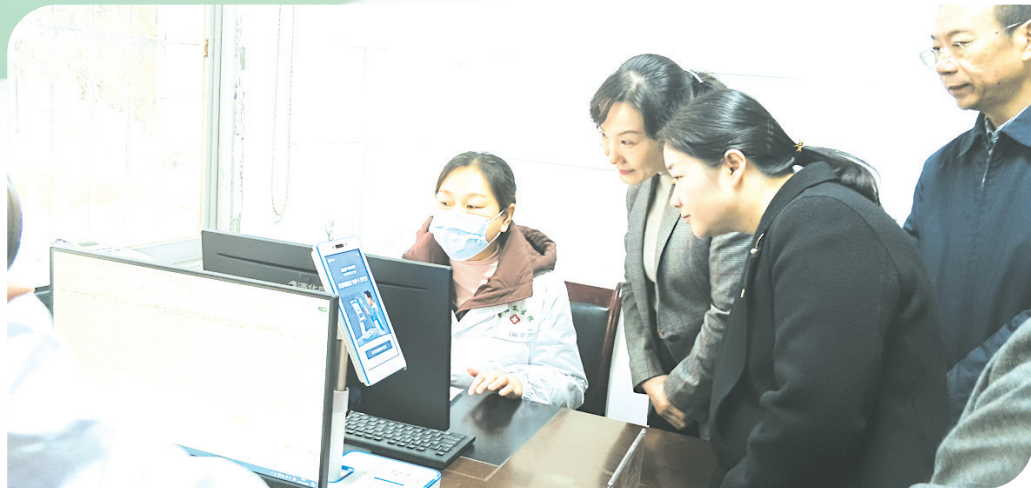
▲ 省医疗保障局党组书记、局长李向东一行来随县安居镇卫生院调研

近年来,随县安居镇卫生院坚持以病人为中心,以提高全镇人民健康水平为目标,致力于改善就医条件、提高医疗质量,不断培养引进技术人才,扎实开展基本公共卫生服务,在乡镇基本医疗和公共卫生服务事业上扮演着越来越重要的角色。