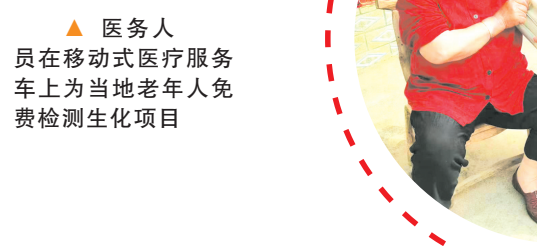
▲ 医务人员为当地老年人免费检测生化项目

积极打造康复专科特色,康复科病区顺利启用,成功加盟随县中医医院医共体。2023年一次性通过“胸痛救治单元”“卒中防治站”“心律失常防治单元”的建设评审工作,对降低心脑血管疾病致死率、致残率,具有重要意义。