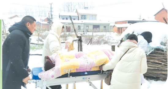
▲ 卫生院医护人员冒着大雪,为生命护航