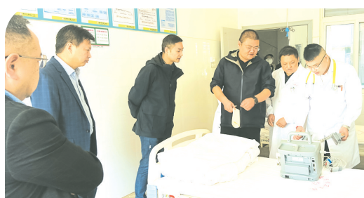
▲ 随州市胸痛中心联盟专家到安居镇卫生院开展胸痛救治单元验收

辅助检查阳性率进一步上升、医疗质量进一步上升、病人满意度进一步上升的良好效果,该院被安居镇党委、政府授予“经济社会发展先进单位”“基层党组织建设先进单位”“党风廉政建设先进单位”。