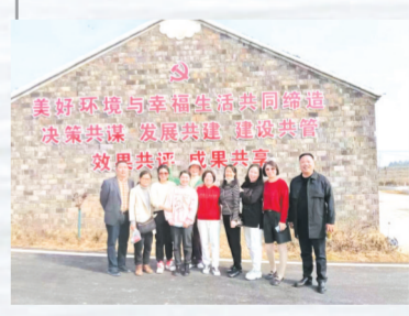
▲ 全体干部职工积极参与美好环境与幸福生活共同缔造行动

柏油路纵横交错,家家户户门庭整洁,七彩墙画寓意深远,景观长廊竞相绽放……走进城郊街道油榨桥村,目之所及,这里一点一滴都为乡村振兴积蓄着力量。 近年来,城郊财政所聚焦乡村发展、乡村建设、乡村治理等乡村振兴重点工作,充分发挥财政职能作用,为巩固拓展脱贫攻坚成果同乡村振兴有效衔接提供财政支撑。 精准选优帮扶项目。通过提前谋划项目,选择一批符合乡村振兴衔接资金投向的高质量项目,注重民生所需,确定发展目标,突出产业融合,择优申报实施群众诉求强烈、联农带农关系密切的项目,以引导农村脱贫群体积极参与,不断提高资金使用效率。2023年,积极帮扶油榨桥村合作公司“寨山林业运营管理有限公司”实施乡村振兴项目,村两委自筹资金120余万元,该所积极向上争取乡村振兴衔接资金80余万元,当年5月建成了蛋鸡物流中心,并投入运营,帮助周边50多位村民解决了在家门口就业的问题,年带动集体增收15万元、群众增收180万元,有效地促进了油榨桥村产业发展、村集体及农户增收。 广泛宣传惠农政策。用心做好服务,严格惠农资金发放。通过向村民发放宣传单、调查走访交流的方式,重点对种粮农户一次性补贴、耕地地力保护补贴、稻谷补贴、棉花补贴等政策进行全方位宣传,提高了群众对各项补贴的知晓率,把党的惠农政策送到群众身边,全年共发放惠农补贴资金566万元,确保了各项惠农资金安全、准确、及时发放落实到位。 不断提升管理水平。在精细化管理上下功夫,实现管理规章制度化、程序流程规范化、操作权限明确化。城郊财政所把用好衔接资金、强化项目管理作为巩固脱贫成效、推进乡村振兴的重要举措。通过科学的规划、规范的管理、高标准的要求等组合拳,充分发挥了资金效益,助力了乡村振兴。 农村美、产业兴、百姓富。如今的城郊街道旧貌换新颜,白天优雅美丽,夜晚灯火阑珊,祥和、务实担当的城郊财政人正在助力乡村振兴的大道上砥砺前行。 励精图治促发展,继往开来谱新篇。2023年,城郊财政所突出抓基础、强管理、严标准、树形象,取得了较好的成绩,也得到了社会的认可。新时期新担当新作为,城郊财政人将紧跟新形势、履好新职责,在基层财政管理中扬长补短,开拓创新,务实有为,为实现乡村振兴奉献新智慧、作出新贡献。