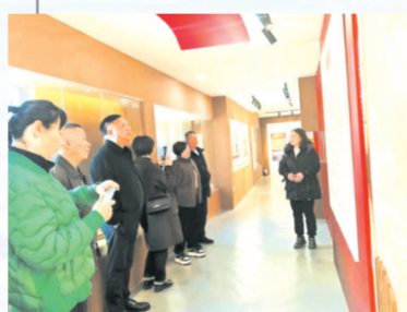
▲ 组织党员开展红色革命教育

问渠哪得清如许?为有源头活水来。城郊财政所采取多项措施培植税源,严格执行“支出从紧、量入为出”的工作原则,千方百计增加可用财力,着力保民生、保工资、保运转,切实规范预算程序,细化预算编制,严控“三公”经费支出,确保把每一分财政资金用在“刀刃”上,使财政支出控制在财力允许范围内,确保了年度预算收支平衡。 着力培植财源。主动与税务部门联系,加强征管力度,深入企业及项目建设区域开展调研式检查,掌握纳税第一手资料,并建立台账,全程管理,加强信息的搜集和反馈,最大限度地挖掘潜在组织财政收入。2023年,完成税收收入5518万元,公共财政预算收入3500万元。 加强资金监管。健全优化本级财务管理制度,明确岗位职责、审批要求权限、财务管理标准,采购报账流程等,规范会计核算,确保会计信息的及时性和准确性。在常态化、规范化、精细化做好各项基础工作的同时,通过实地检查、定期抽查、电话询问等形式,有效加强全办财政资金使用情况、惠农政策落实、项目资金兑付等事前、事中、事后的监督检查,防范化解政府开支隐性风险,保障各类资金使用规范透明。 严格“三资”管理。严格实行资金收支两条线管理,村集体资金收入全额缴存代管资金账户,集中管理;支出申报,逐级审批;大额开支,民主决策,集体工程项目建设实行公开招标,确保了农村集体资金使用的合理性、合法性、民主透明,杜绝了乱开支,减少了违纪违法问题的发生。流动资产、固定资产的处置,严格按照村级“四议两公开”程序,严禁流失集体资产。农村集体所有的山林、水面、滩涂、农田、“四荒地”等经济资源的发包、租赁或其他方式的处置,一律按照“四议两公开”决策。 强化队伍建设。城郊财政所把全方位提升财政队伍的综合业务素质和专业技能放在重要位置,加强业务培训,开展自学、互帮互学,让财政业务知识人人懂、业务工作人人会,进一步提升财政管理水平。