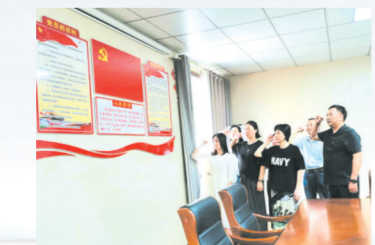
▲ 全体党员重温入党誓词