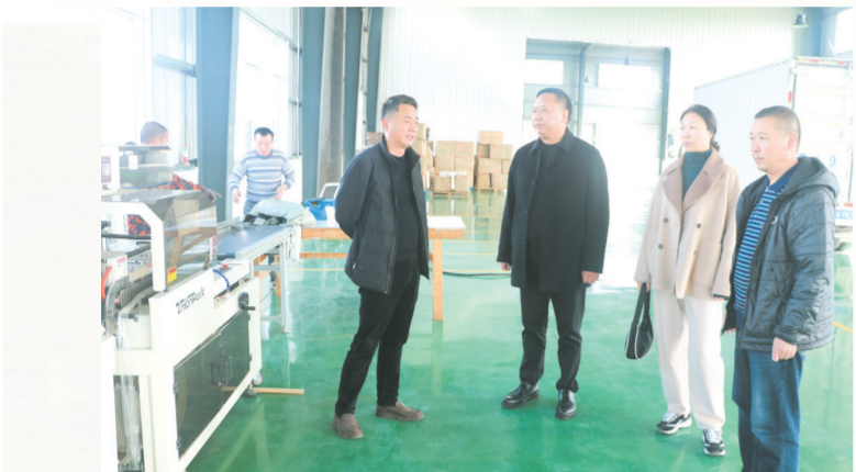
▲ 财政所班子成员深入企业宣传惠企政策,优化营商环境

“砥砺奋进谋发展,聚财理财惠民生。”这是广水市城郊财政所全体干部职工坚守的工作准则和奋斗目标。 2023年,城郊财政所在广水市财政局党组和城郊街道党工委、办事处的正确领导下,以党的二十大精神为指导,以服务群众、群众满意为宗旨,牢固树立聚财为公、理财为民的理念,坚持生财聚财一流增收,财务运行一流监管,为民理财一流服务,窗口形象一流提升,财政队伍一流管理,科学谋划,积极应对经济下行带来的财政收支矛盾,全力保运转、促发展、保民生,为促进城郊街道经济社会健康平稳发展作出了积极贡献。