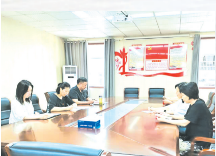
▲ 开展主题党日活动

“砥砺奋进谋发展,聚财理财惠民生。”这是广水市城郊财政所全体干部职工坚守的工作准则和奋斗目标。 2023年,城郊财政所在广水市财政局党组和城郊街道党工委、办事处的正确领导下,以党的二十大精神为指导,以服务群众、群众满意为宗旨,牢固树立聚财为公、理财为民的理念,坚持生财聚财一流增收,财务运行一流监管,为民理财一流服务,窗口形象一流提升,财政队伍一流管理,科学谋划,积极应对经济下行带来的财政收支矛盾,全力保运转、促发展、保民生,为促进城郊街道经济社会健康平稳发展作出了积极贡献。