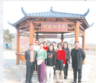
▲ 发挥财政职能助力乡村振兴