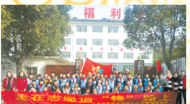
▲广水市实验小学少先队员走进阳光福利院