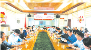
▲神农架教育考察团在广水市教育局领导陪同下来实验小学学习观摩