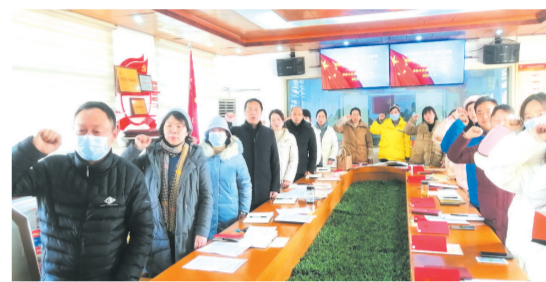
▲广水市实验小学扎实开展主题党日

一大”决策制度。 立岗树人,锻造教师队伍。学校党组织创新开展“党员示范岗”创建活动,真正地把党员的先锋模范作用发挥好。“安全卫生示范岗”完善各项安全制度,做好各种应急预案,从道路交通、食品卫生、校舍设施、卫生防疫等方面把安全卫生工作抓实抓细,筑牢校园安全防线。“教育教学示范岗”结对青年教师,通过示范课引领、指导课堂教学、带领开展研学活动等,不断提高青年教师综合素养。“志愿服务示范岗”倾心服务,志愿先行,反诈宣传、卫生清扫、走街串巷、入户摸排、铲雪除冰等处处有他们的身影,彰显了共产党员的责任和担当。 立德树人,培养时代新人。学校深入落实立德树人根本任务,切实发挥党建引领作用,积极开展“四个一”系列活动。开展一次红色主题实践活动,组织少先队员分别到吴店镇红色教育基地和应山革命烈士纪念碑前开展“缅怀革命先烈,传承革命精神”活动,进一步增强革命传统教育的实效性和感染力。