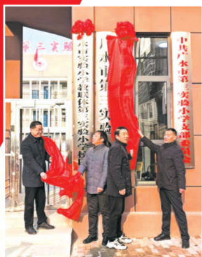
▲广水市实验小学教联体第三实验小学校区揭牌仪式