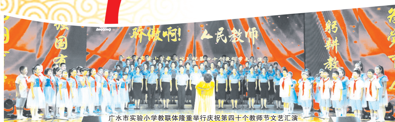
广水市实验小学教联体隆重举行庆祝第四十个教师节文艺汇演