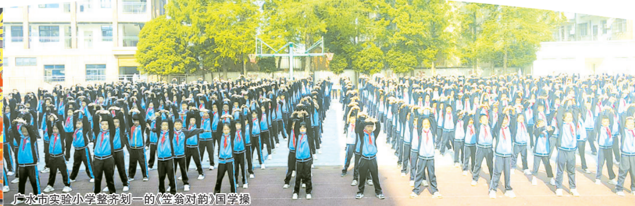
广水市实验小学整齐划一的《签约对韵》国学操