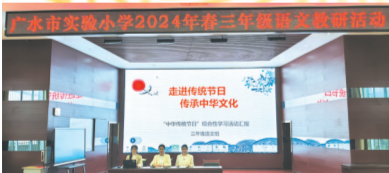
▲广水市实验小学“周二大舞台 教研展风采”教研活动