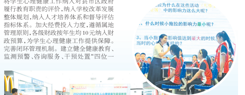
▲ 中小学心理健康教育指导中心举办心理健康与家庭教育系列宣教活动

青少年心理健康是一项长期性、复杂性、专业性的系统工程,需久久为功。随州市政协将进一步回应社会关切,紧盯青少年心理健康问题,深入开展调研协商,助推解决难点堵点问题,用心用力培育好青少年心理健康的“优质土壤”,助力学生向阳生长,如花绽放。