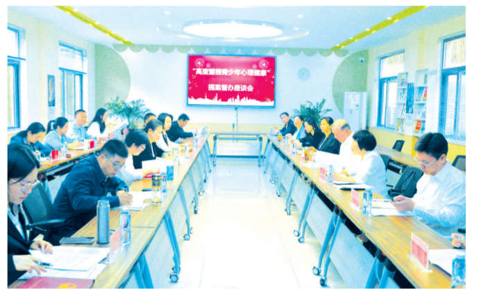
▲ 市政协组织召开“高度重视青少年心理健康”提案督办座谈会

“学校是中小学生日常生活的重要组成部分,学校环境同样对学生的心理健康产生深远影响。” “要在家庭工作中找准立德树人切入点,帮助孩子扣好人生第一粒扣子。要不断提升家庭教育服务水平,为广大家庭解除后顾之忧。” “呼吁社会上更多的人真正参与到学生的心理健康工作中来。” …… 商以求同,协以成事。为不断凝聚做好青少年心理健康工作的共识,10月24日,市政协召开双月专题协商会,围绕“关爱学生心理健康,促进青少年阳光成长”开展专题协商建言,委员们和相关部门纷纷结合自身实际,积极建言献策,提出了一系列具有针对性和可操作性的建议,为青少年儿童的健康成长保驾护航。