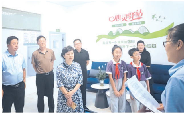
▲ 市政协开展“关爱学生心理健康 促进青少年阳光成长”专题调研