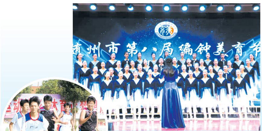
▲ 各学校开展丰富多彩的体育美活动

“为什么现在很多孩子出现焦虑、抑郁?”“为什么青少年自残自伤等极端行为频发?”近年来,一系列关于青少年心理健康的问题和事件引发社会持续关注和讨论。 青少年心理健康工作关系着万千家庭的幸福安宁。随州市政协将《关于高度重视青少年心理健康的建议》作为重点提案,开展专题调研,分析问题根源,积极建言献策。 10月中旬,市政协主席冯茂东带队,对《关于高度重视青少年心理健康的建议》重点提案办理情况进行调研督办。调研组先后来到曾都区五丰学校、曾都区第一中学等地,察看心理健康室、校园文化阵地,详细了解心理学建设、教师人才培养、心理健康教育、家校社协同育人等情况。 冯茂东强调,要高度重视青少年心理健康问题,切实加强青少年心理健康教育,坚决扛起呵护青少年心理健康的责任担当,进一步提高站位、压实责任、落实举措、凝聚力量,为青少年心理健康筑牢“防护网”、架好“连心桥”、当好“守护者”。要齐抓共管,发挥好家庭教育“第一防线”作用、学校教育主阵地作用、社会环境保障作用,坚持预防为主、关口前移,强化家庭、学校、社会联动发力,共同守护青少年心理健康。要建立健全联动高效的工作机制,完善家庭教育指导机制,健全及时干预机制,建立专业协作机制,形成经常抓、抓经常的工作局面,助力青少年健康成长。 9月下旬,市政协副主席黄秋菊带队到随州开展关爱学生心理健康专题调研,调研组先后到随县一中、随县炎帝学校,现场参观学校心灵驿站,听取学校负责人关于学生心理健康教育的工作汇报,并召开座谈会。 调查研究是做好履职工作的基本功,也是政协工作的“压舱石”。在多次的调研中,委员们了解到各地积累的一些好经验、好做法。