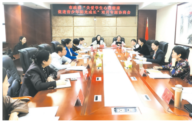
▲ 市政协围绕“关爱学生心理健康 促进青少年阳光成长”召开双月专题协商会