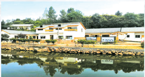
▲ 和美乡村建设一角

近年来,温泉村充分发动群众参与村庄建设和环境整治,重点对江汉路改造、红色文化广场、村庄道路段环境整治、碾子湾共同缔造点全面提档升级。先后筹措整合资金5000多万元,撬动社会资金8000多万元,拓宽硬化道路40公里,刷黑红色旅游公路3公里,整治塘堰40口,建成700平方米的党群服务中心,打造“乡村旅游驿站”,对270间房屋进行了徽派建设风格立面包装,安装太阳能路灯100盏,铺装彩砖人行道4200平方米,新建1500平方米的中心文化广场,安装下水道1600米。