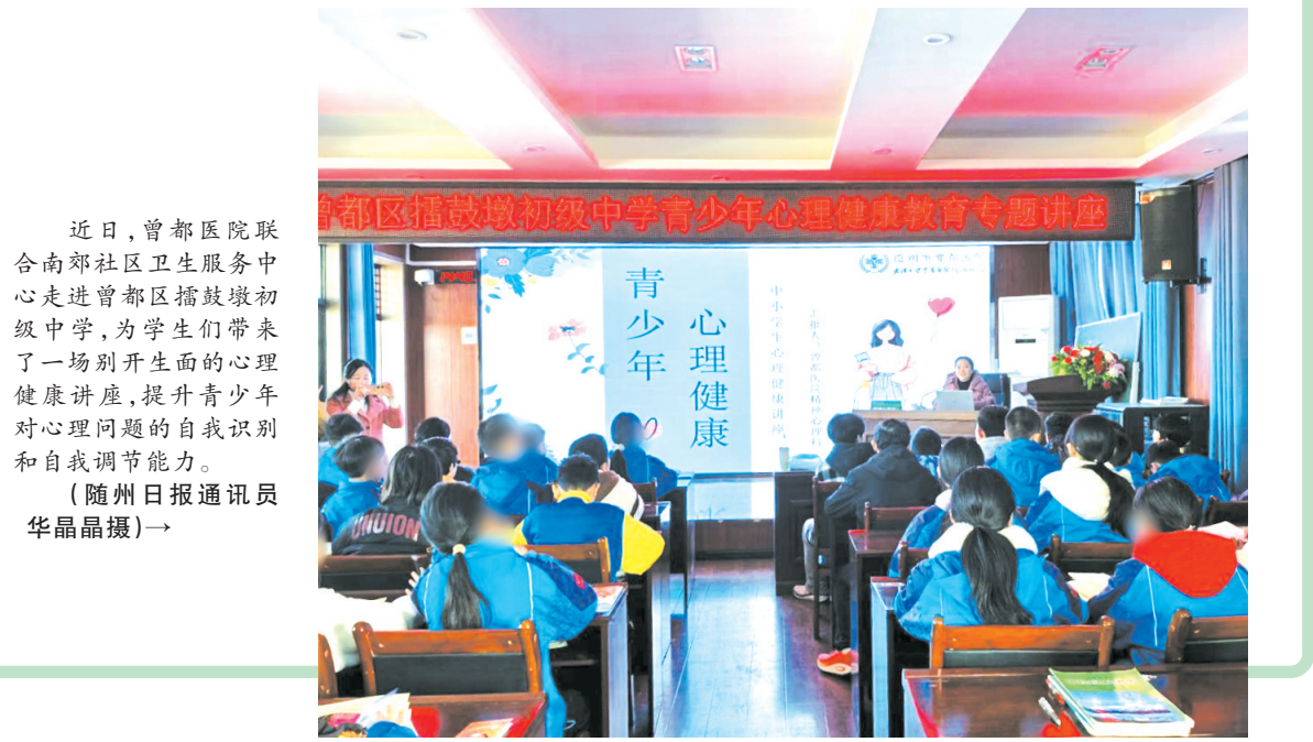
近日,曾都医院联合南郊社区卫生服务中心走进曾都区擂鼓墩初级中学,为学生们带来了一场别开生面的心理健康讲座,提升青少年对心理问题的自我识别和自我调节能力。