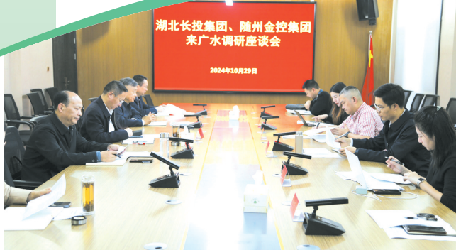
湖北长投集团、随州金控集团到广水调研