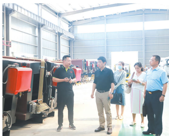
▲ 到企业调研，了解企业融资需求