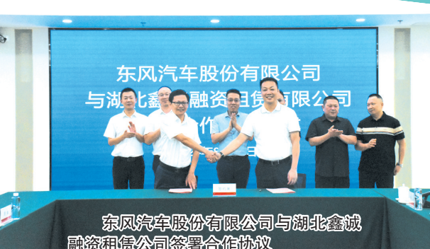
东风汽车股份有限公司与湖北鑫诚融资租赁公司签署合作协议