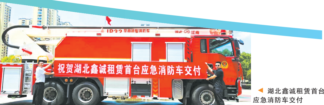
湖北鑫诚租赁首台应急消防车交付