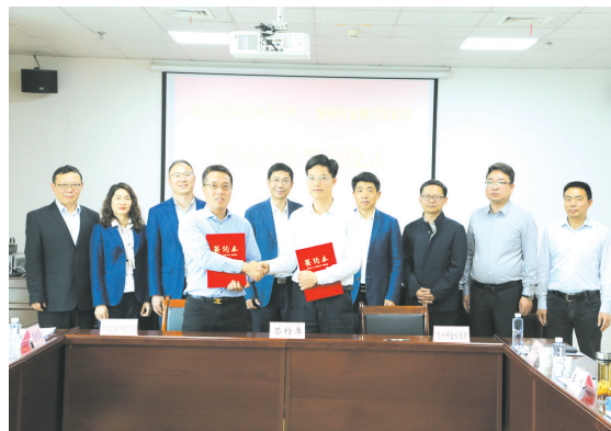
▲ 湖北鑫诚融资租赁公司与随州市金控集团股权投资签约仪式