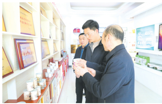
▲ 深入企业走访调研