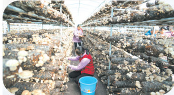
▲柏树湾村明阳食品有限公司