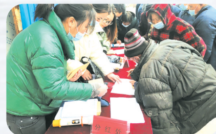
▲种植养殖专业合作社带动农户增收