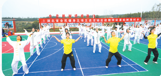
▲柏树湾村文体广场

和美乡村建设,生态宜居是关键。柏树湾村以农村人居环境整治行动为抓手,努力营造干净整洁、文明有序的人居生活环境,打造宜居宜业美丽乡村。 走进柏树湾村,宽阔的沥青路面蜿蜒起伏,延伸至大山深处,白墙黛瓦、环境宜人,人在村中走,宛若画中游。 以近千年古黄栌树为依托建造的古树村落风景如画,是许多人到柏树湾村游玩必去的打卡点,古树村落民宿便位于此地。闲置农房改头换面,变成崭新的乡村民宿。这里没有城市的喧嚣,有的是凡尘烟火中的幸福。这里有悠闲垂钓的堰塘、美丽的荷塘月色、向阳而开的油菜花,不同的季节呈现出不同的美景。 经过改造升级,9.8公里的通村公路现已成为宽敞的柏油路,路面宽达6米,极大地方便了村民出行和游客到访。通组公路两旁还进行了美化、绿化和亮化工程,安装了70盏太阳能路灯,夜间照亮了村民的回家路,也增添了乡村夜景的魅力。 道路旁,新设置的交通标识牌提供了清晰的方向指引,同时也介绍了村内的特色产业和文化亮点,让外来游客能够快速了解村庄的特色和魅力。这些变化不仅提升了村庄的整体形象,也为村民的生活带来了实实在在的便利。 绿水青山就是金山银山,生态环境是乡村的“命脉”。“收益再好的项目,只要是破坏生态环境的,一律不准引进”,这是柏树湾村的共识。曾有一位老板看好柏树湾的生态环境,提着钱要来办养猪场,被婉言拒绝了。还有2家企业要来采掘砂石料,也吃了“闭门羹”。 柏树湾村积极探索盘活利用农用地、