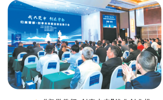
▲ “归巢曾都·创享未来”就业创业推 介会在东莞市举行