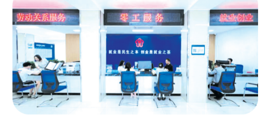
▲ 曾都区“零工驿站一站式服务案例”荣获 第三届公共就业服务专项业务竞赛全国总决赛 优秀就业服务案例三等奖