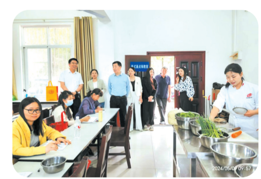
▲ 市人大常委会副主任张道亮调研 全市就业促进工作