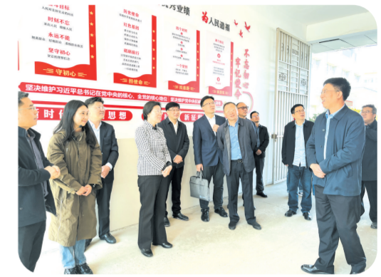
▲ 省人社厅党组书记、厅长李述永 调研我市稳就业工作

工”技能人才培养新模式被纳入2024年省优化营商环境改革试点。省人社厅、省就业中心主要领导多次到我市调研指导。 2024年,市、县人社部门持续实施擦亮“香菇种植工”劳务品牌“五个一”工程,邀请省就业中心领导、人社部劳务品牌专家对品牌建设作专题辅导,确定了“规范化培育、技能化开发、规模化输出、品牌化推广和产业化发展”的建设方向。2024年出版发行全国首本《随县香菇种植技术》培训教材,研究制定“随县香菇种植工”专项职业能力考核规范,建设“随县香菇种植工”实训基地开展技能培训3000余人,上线“随县香菇种植工”技能人才服务企业服务平台,2000多名“土专家”活跃在新疆、十堰、贵州等全国各地开展技术培训和行业指导。 以“随县香菇种植工”劳务品牌“五个一”建设为标准,全市人社部门将持续培育、擦亮、做实劳务品牌建设工作,力争打造更多在全省、全国范围内有影响力的地方特色劳务品牌,带动更多劳动者实现就地就近就业。