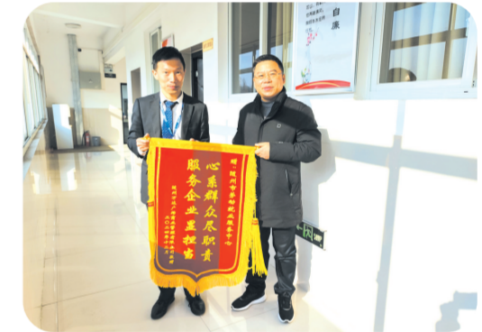
▲ 万达广场向市就业服务中心赠送感谢锦旗