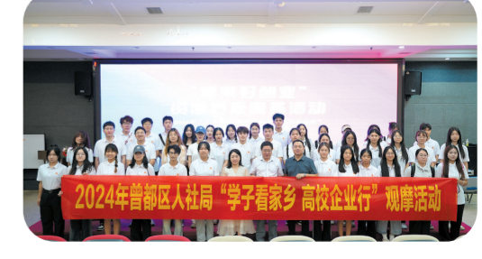
▲ 举行“学子看家乡、高校企业行” 观摩活动