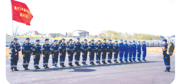
▲社会应急救援队伍集结培训