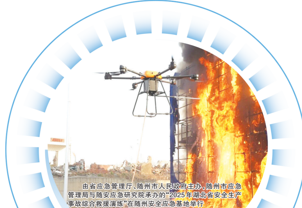
由省应急管理厅、随州市人民政府主办,随州市应急管理局与随安应急研究院承办的“2025年湖北省安全生产事故综合救援演练”在随州安全应急基地举行

新征程催人奋进,新使命重任在肩。“十五五”的大幕已经拉开,随州市应急管理局正以“一马当先”的昂扬斗志、“马不停蹄”的实干作为,凝聚全局力量、锚定目标方向,持续推动应急管理体系和能力现代化建设。站在新的历史起点,随州应急管理人将继续坚守初心、勇担使命,凝心聚力、锐意进取、扎实工作,奋力开创全市应急管理事业发展新局面,为随州“三地一枢纽”建设、推动“整体提升环境、建功支点建设”取得决定性进展,筑牢更加坚实可靠的安全屏障,以实干与担当书写新时代应急管理事业的崭新篇章!