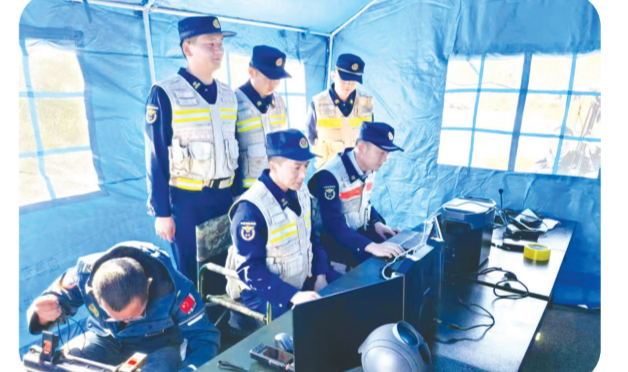
▲市应急管理局联合随州军分区、市消防救援支队等部门,开展模拟“三断”极端条件下的应急指挥通信演练