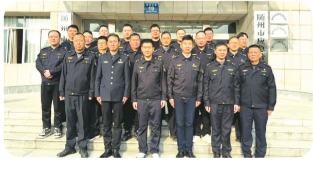
▲市应急管理局“一线应急铁军”应急突击队编组