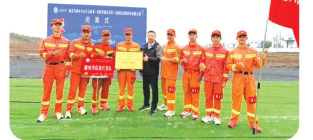
▲市应急管理局组建随州市代表队参加湖北省第六届森林消防职业技能竞赛,获负重越野项目二等奖

装备保障是应急救援的“利器”,随州持续加大应急救援装备投入,累计为基层配发价值超亿元的救援装备,引入中型复合翼无人机,高效落实国债装备3677台(套),并组织开展集中培训,确保装备快速形成战斗力。同时,随州作为承担应急部、省应急管理厅行业活动最多的市州之一,成功承办多项省级重要演练活动,通过以演代练、以练促战,极大提升了多部门协同处置能力,让应急救援队伍在实战实训中锤炼本领、提升能力。