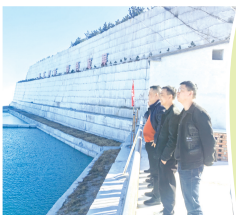
▲ 随县自然资源和规划局实地推进国家级绿色矿山创建工作