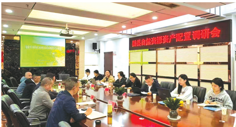
▲ 随县自然资源和规划局与中国地质大学(武汉)公共管理学院座谈交流自然资源资产配置工作,助力地方发展