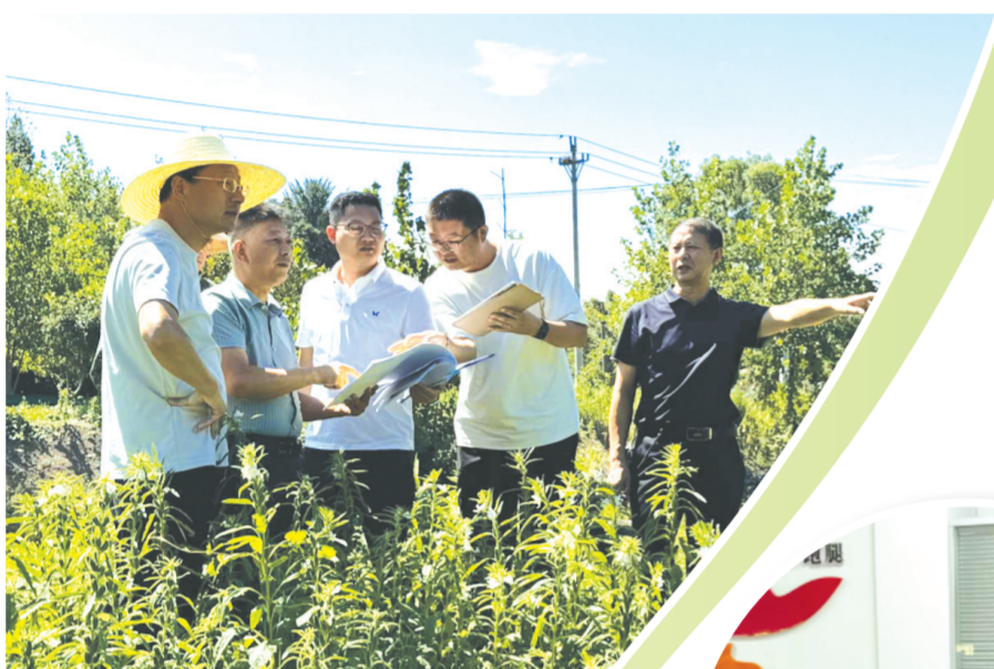
▲ 随县自然资源和规划局深入实地协调,高效推进地下空间开发利用项目落地见效