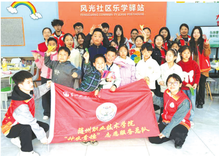
3月29日,曾都区涇水街道风光社区联合仁爱社会工作服务中心、随州职业技术学院神农青德志愿者服务队,在社区青少年活动中心开展首期“风光友邻·童趣公益课堂”活动。本次活动将红色精神传承与传统文化浸润有机融合,让孩子们在沉浸式体验中感悟红色精神力量、收获成长喜悦。

“群众有困难,我们当干部的就得想办法。”何店镇平安建设办相关负责人表示,这起纠纷的成功化解,正是“小事不出村、大事不出镇、矛盾不上交”的生动实践。下一步,平安建设办将继续用好“多元解纷”联动机制,把群众的烦心事当成心头事,用实实在在的行动化解矛盾、温暖人心。