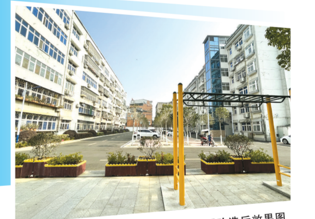
老旧小区改造后效果图