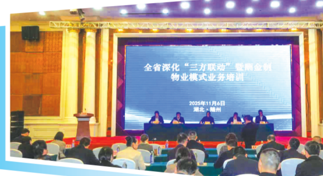
全省深化“三方联动”暨酬金制物业模式业务培训会在随州召开