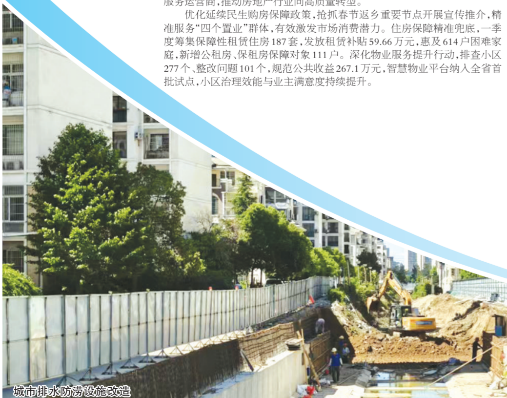
城市排水防涝设施改造