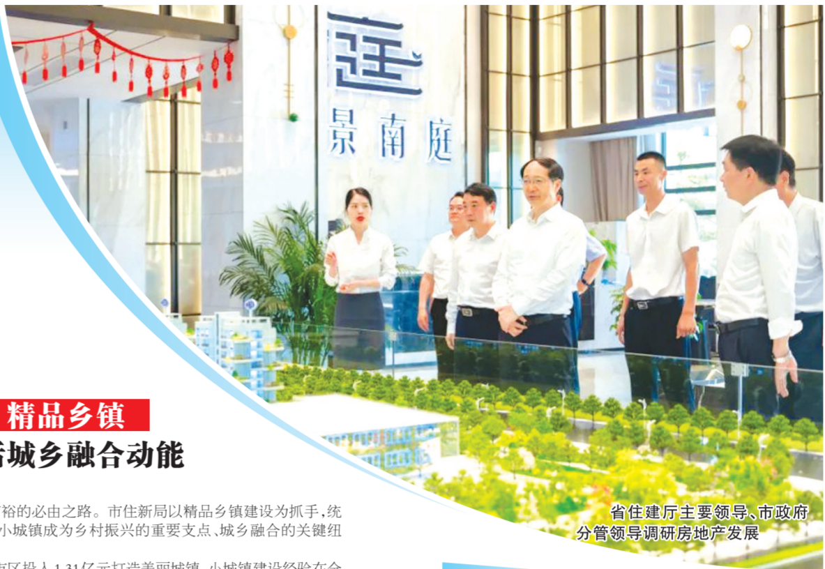
省住建厅主要领导、市政府分管领导调研房地产发展

征程万里风正劲,重任千钧再出发。站在新的起点,随州市住房和城乡建设局将始终坚守初心、勇担使命,以更高标准推进项目建设,以更实举措深化城市更新,以更优服务保障民生需求,以更强大助力城乡融合,奋力推动住房和城乡建设工作再上新台阶,为加快建设具有随州特色的现代化人民城市作出新的更大贡献!