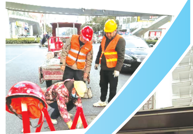
城市市政道路窞井盖维修更换