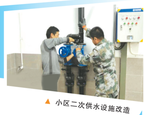
小区二次供水设施改造