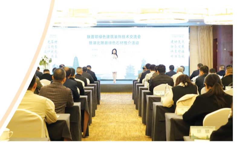
▲ 陕鄂鄂绿色建筑装饰技术交流会暨随县石材精准推介活动