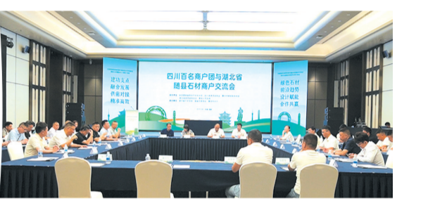
▲ 2025年川渝鄂绿色建筑和绿色建材经济技术交流会暨湖北随县石材推广会