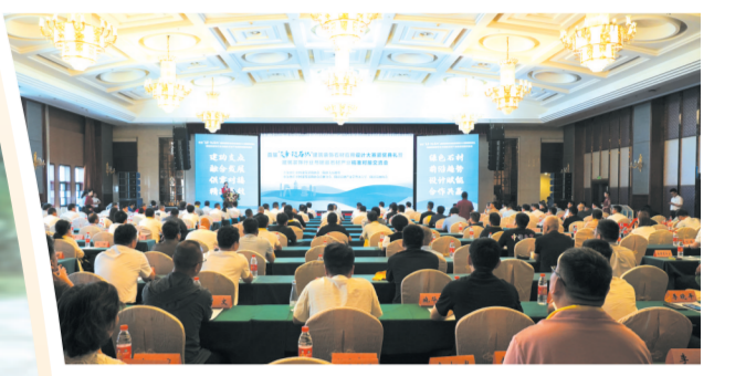
▲ 首届“炎帝·随石杯”建筑装饰石材应用设计大赛颁奖典礼暨建筑装饰行业与随县石材产业精准对接交流会