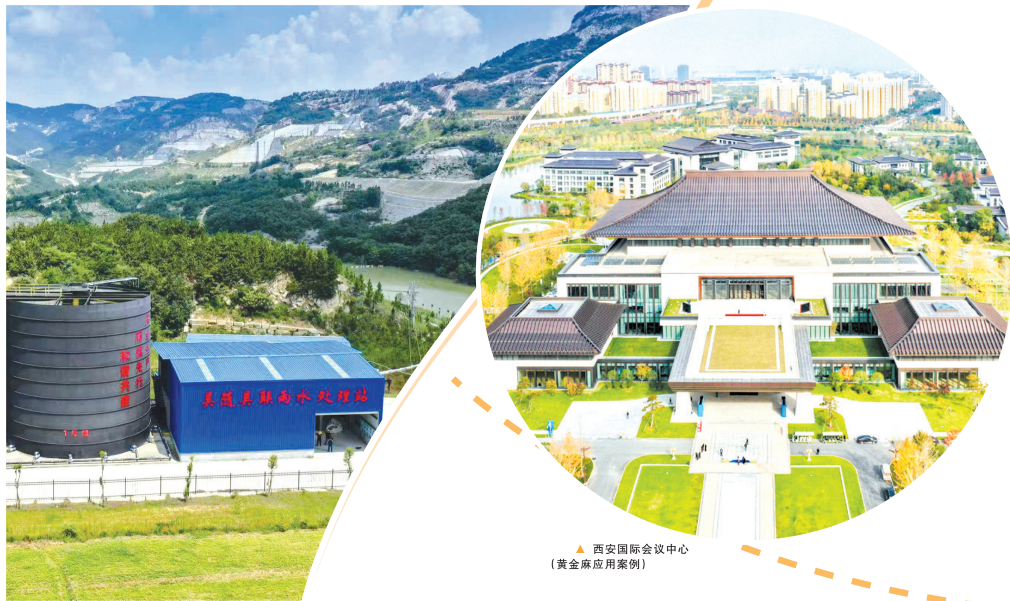
▲ 西安国际会议中心 (黄金麻应用案例)