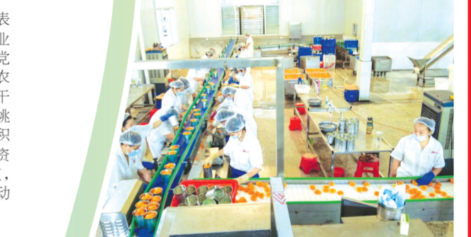
▲ 黄桃罐头加工生产车间

在产业发展过程中,党员骨干主动亮身份、作表率,带头参与基地建设、技术学习、产销对接,成为产业发展的“领头雁”和“排头兵”。村党支部深化“党建+合作社+农户”发展模式,依托湖北省天坡现代农业有限公司,持续完善“公司+合作社+村集体+农户+种植大户+脱贫户”利益联结机制,不断扩大黄桃种植规模,着力打造天坡特色黄桃产业名片。同时,积极探索村企合作新路径,计划将村级集体经济发展资金与企业联合开发新项目,延伸产业链,提升附加值,持续壮大村级集体经济实力,为乡村振兴注入强劲动力。