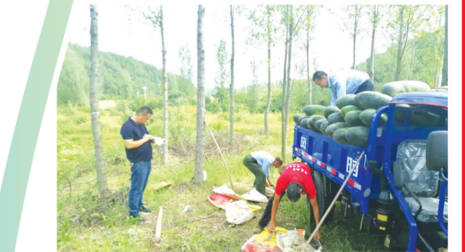
▲ 大力发展黑皮冬瓜种植