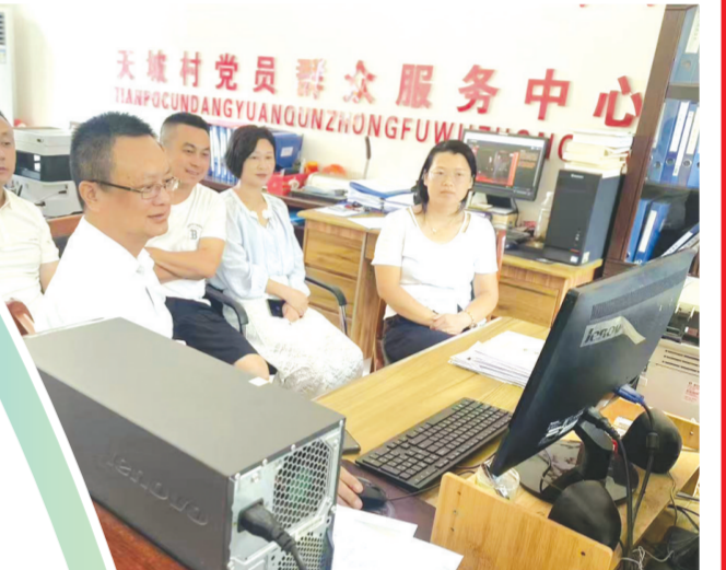
▲ 天坡村党群服务中心

为增强学习实效,支部创新学习形式,丰富学习载体。主题党日活动中,组织全体党员重温入党誓词、学习党章党规,强化党员身份意识与责任担当;组织党员赴祝林店革命历史纪念馆开展红色教育,传承红色基因,汲取奋进力量。每次学习后,要求到党员结合自身实际谈体会、谈感悟,推动理论学习成果转化为干事创业的实际行动。