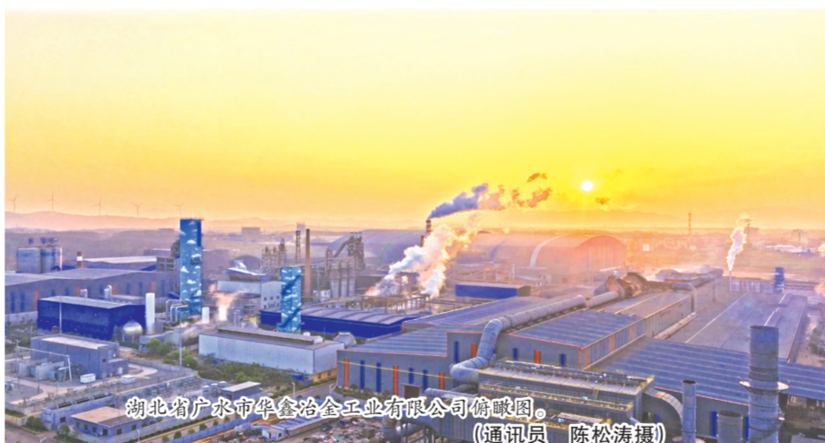
湖北省广水市华鑫冶金工业有限公司俯瞰图。

要素保障服务精准高效。建立政企常态化沟通机制和交流平台,通过市级领导、市直部门挂钩联系全市重点民营企业,有效实现企业问题第一时间收集、化解、反馈,为产业发展提供全方位、全周期保障。2025年,该市兑现惠企资金2802.89万元,惠及企业177家次。