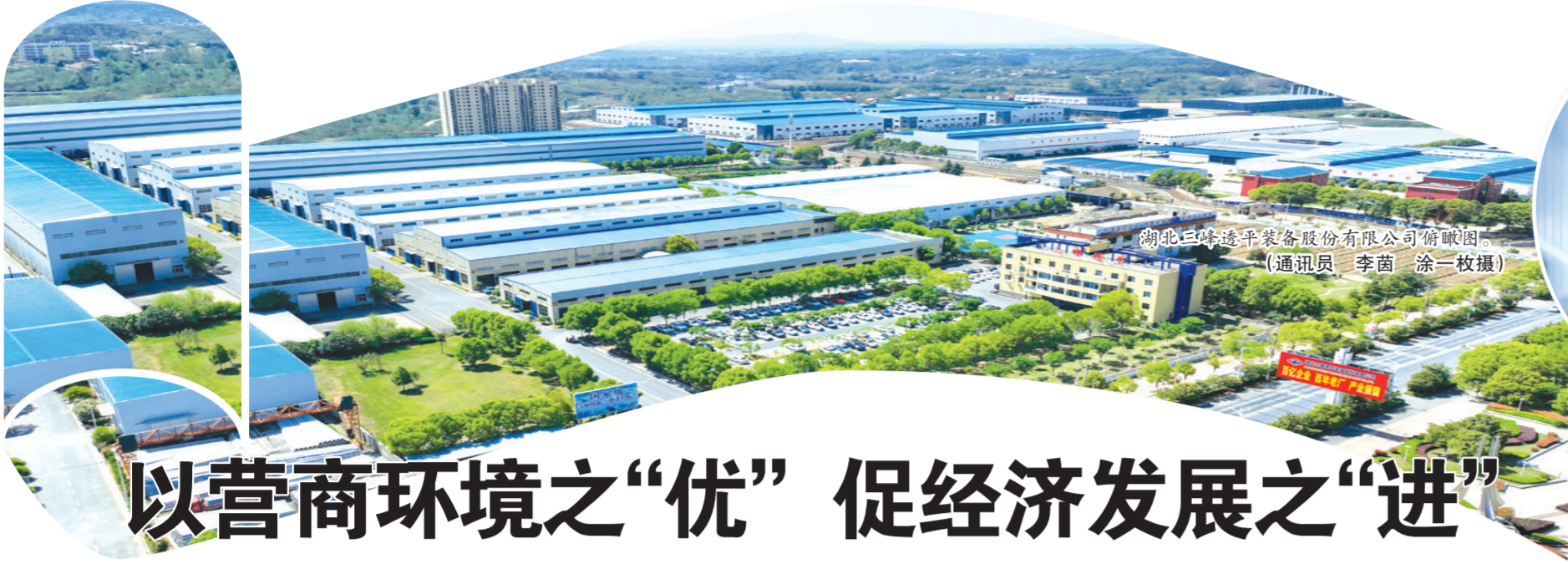
湖北三峰透平装备股份有限公司俯瞰图。