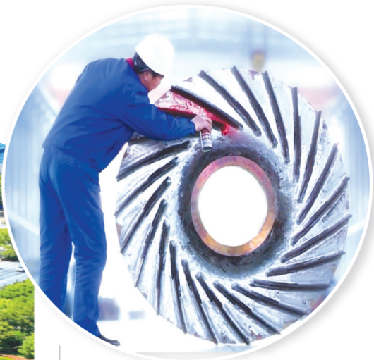
湖北三峰透平装备股份有限公司生产车间,工人正为风机叶片喷漆。