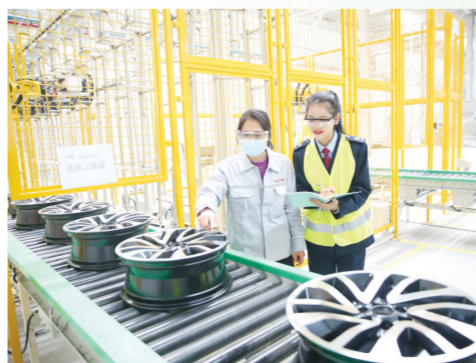
▲ 税务人员到企业调研生产情况