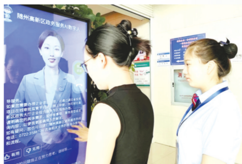
▲ 随州高新区政务服务大厅推出AI数字人“高小新”,全天候为企业和群众提供政务咨询服务