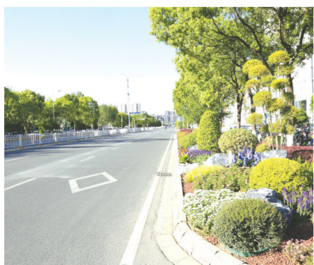
▲ 随州高新区常态化推进城乡环境提升行动