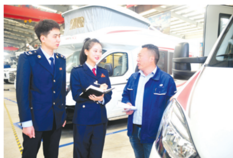
▲ 随州高新区税务局干部到企业开展帮扶活动

完善考评奖惩机制。制定《随州高新区优化营商环境工作考核奖惩暂行办法》,签订营商环境评价指标优化提升责任书,明确工作任务,压实工作责任,变压力为动力,进一步激发全区上下做好营商环境工作的信心和决心。