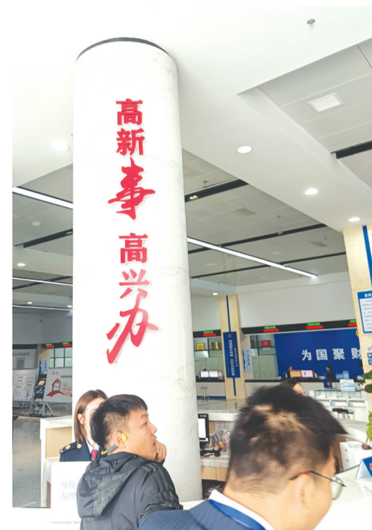
▲ 随州高新区精心打造“高新事高兴办”政务服务品牌