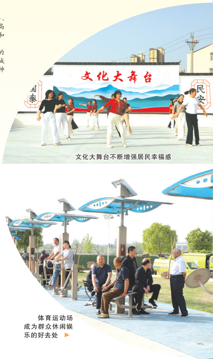
文化大舞台不断增强居民幸福感