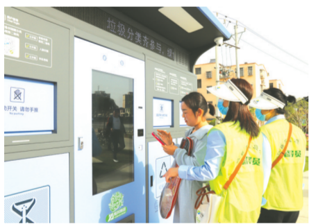
▲ 随州高新区联合耀邦环境公司在裕民社区开展垃圾分类、积分兑换活动

必先自治,乃可治人。随州高新区通过“典型引领”与“全域推进”相结合,让辖区避免“一花独放”的尴尬。每周下发重点工作提示,督办专班、创城办联合开展实地督导,制发可视化视频通报20期,反馈问题50余个。同时,将创文工作落实情况纳入重点工作绩效考核和干部纪实档案,对推进缓慢、履职不力的单位和个人下发督办函并全区通报批评。