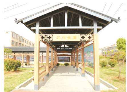
▲ 文化长廊成为文明城市创建的亮丽窗口